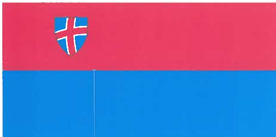
Zastava Občine Piran