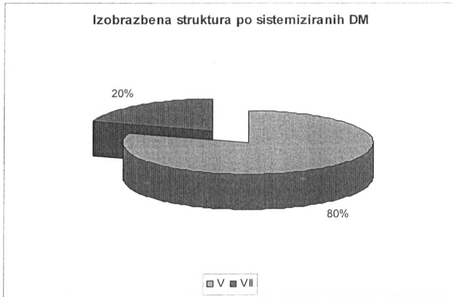
Graf št. 2: Izobrazbena struktura po sistemiziranih delovnih mestih