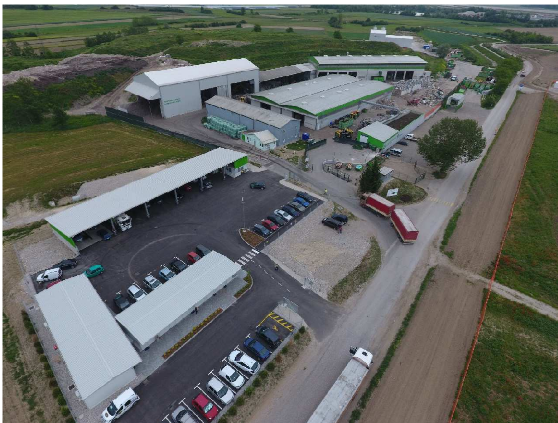
Slika 2: Center za ravnanje z odpadki Spodnji Stari Grad

Pred glavnim vhodom na CRO SSG je tabla z osnovnimi informacijami, kot so: obratovalni čas, telefonska številka ter shema centra. CRO SSG vključuje: