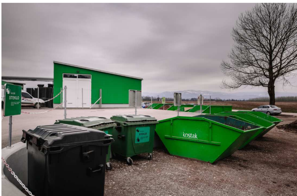
Slika 3: Zunanji ekološki otok na Centru za ravnanje z odpadki Spodnji Stari Grad