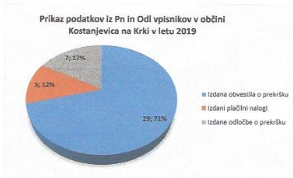
Graf 2: Prikaz podatkov iz Pn in Odl vpisnikov za leto 2019