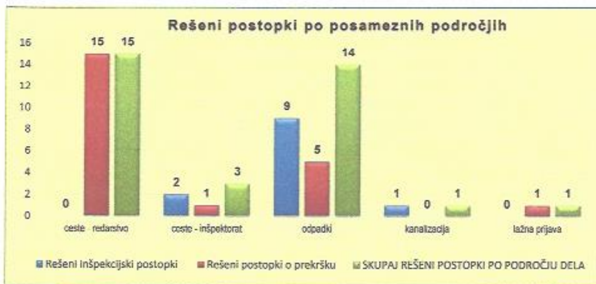
Graf 4: Število rešenih postopkov po posameznih področjih

Predstavljamo vam posamezne ugotovitve nadzora po posameznih področjih rešenih zadev.