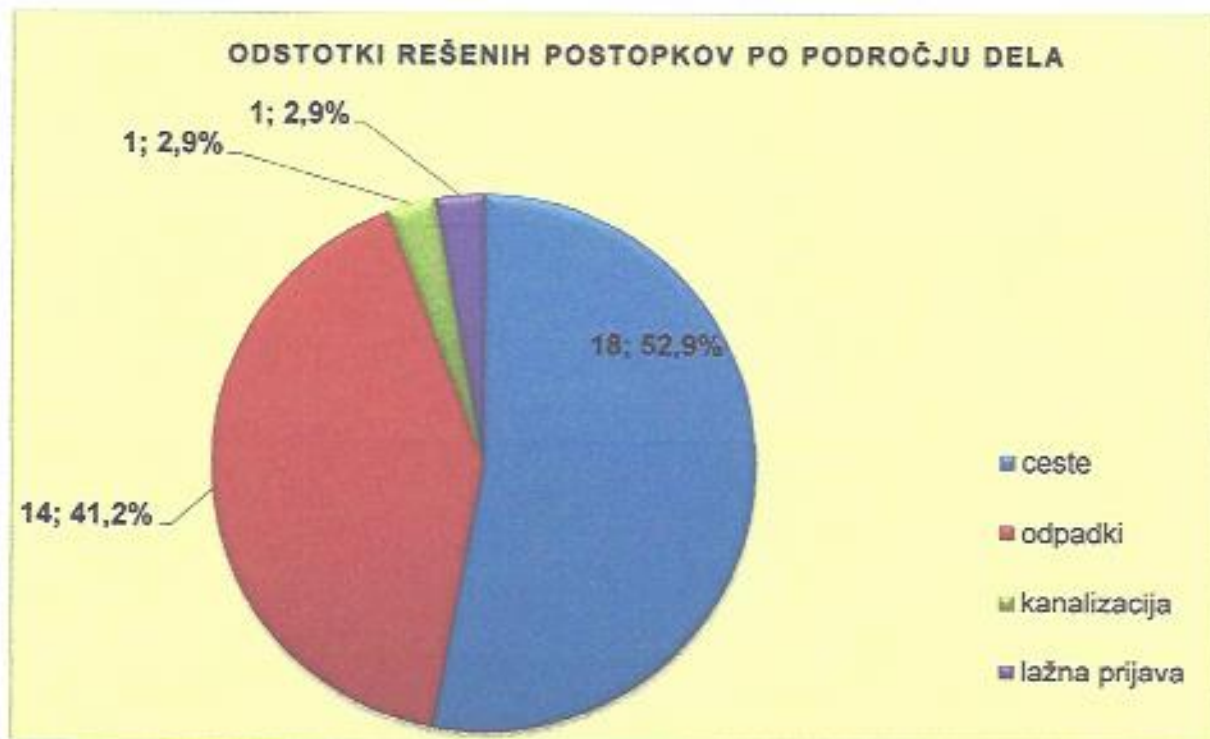
Graf 5: Odstotki rešenih postopkov po področju dela