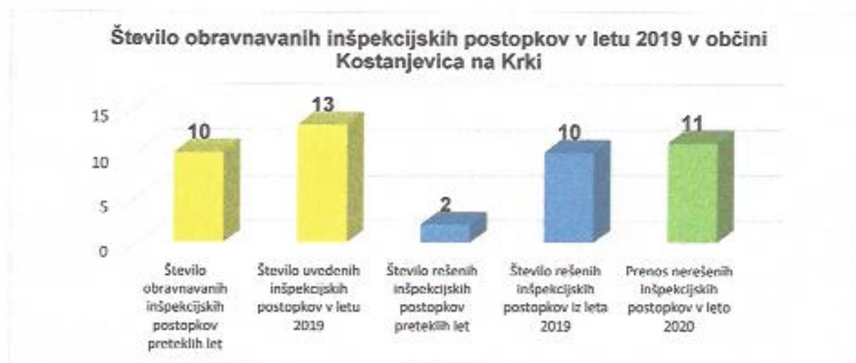
Graf 3: Število obravnavanih inšpekcijskih postopkov v letu 2019