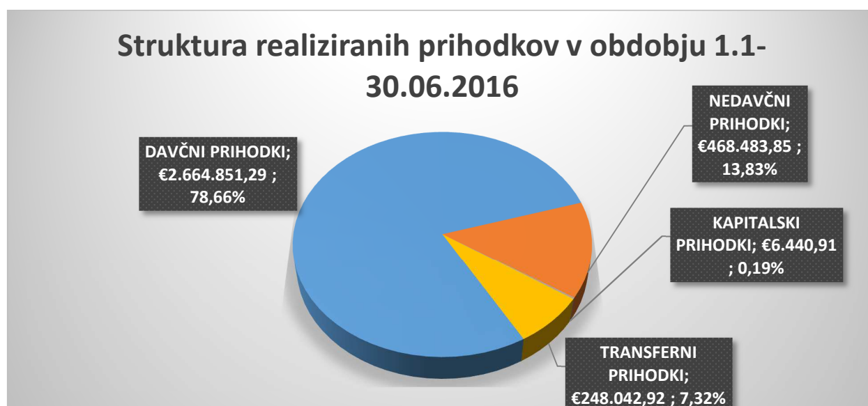
Grafikon št. 1: Struktura realiziranih prihodkov od 01.01.2016 – 30.06.2016

Iz bilance prihodkov in odhodkov splošnega dela proračuna je razvidno, da so bili celotni prihodki realizirani v višini 3.387.818,97 € (v letu 2015=3.338.789 €), oz. 46,6% glede na veljavni proračun. Realizirani prihodki so glede na enako obdobje iz leta 2015 višji za 49.030 € oz. 1,47%.