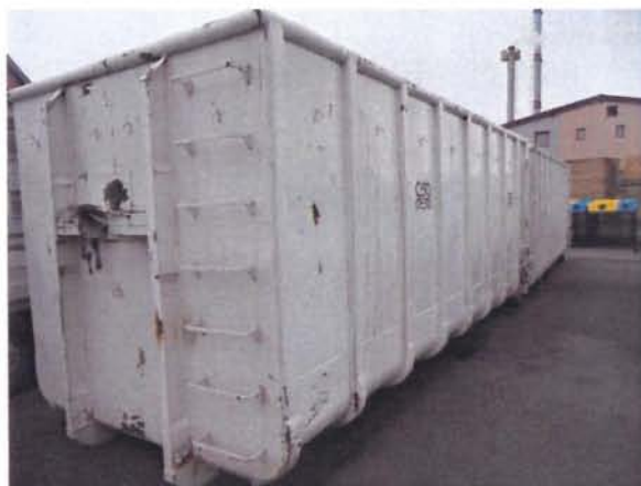
Fotografija 15 in 16: Kontejnerji različnih volumnov za zbiranje kosovnih in drugih odpadkov