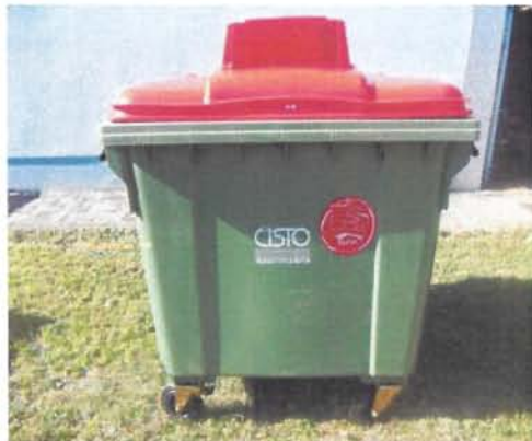
Fotografija 5 in 6: Posode za zbiranje papirja

Za zbiranje plastične embalaže ter ločenih frakcij iz plastike bomo uporabljali: