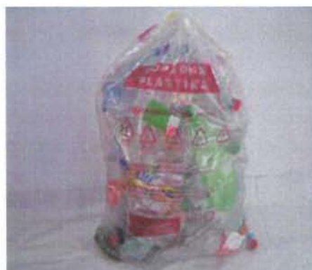
Fotografija 7: Vrečka za mešano embalažo

Za zbiranje steklene embalaže, ki poteka preko zbiralnic ločenih frakcij uporabljamo plastične zabojnike, volumnov 240 l in 1100 l in sicer: