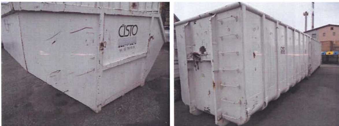
Fotografija 10 in 11: Kovinski kontejnerji