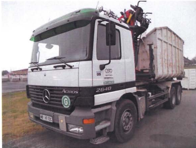
Fotografija 17: Vozilo za prevoz kotalnih prekucnikov

Za prevzemanje in prevoz kosovnih odpadkov uporabljamo kontejnerska vozila ter vozila za prevoz kotalnih prekucnikov.