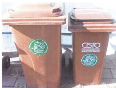
Fotografija 4: Posode za biološke odpadke