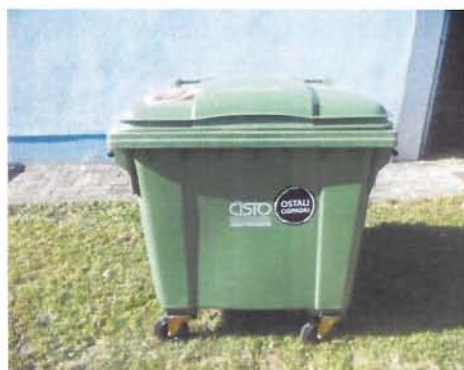
Fotografija 2 in 3: Posode za mešane komunalne odpadke