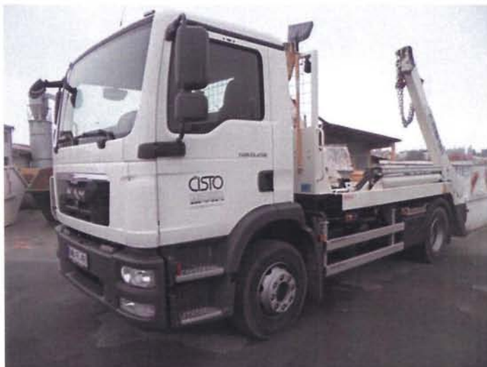
Fotografija 14: Vozilo za prevoz kontejnerjev

Za zbiranje in prevoz odpadkov iz zbirnih centrov, uporabljamo specialna komunalna vozila za odvoz kontejnerjev večjega volumna: