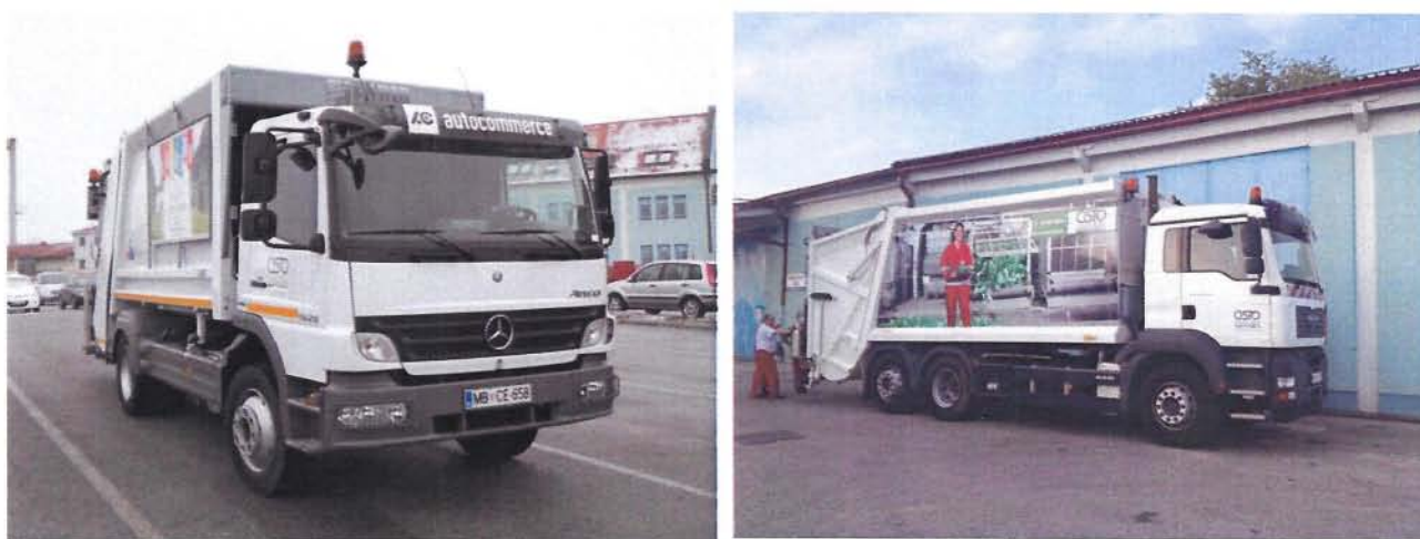
Fotografija 12 in 13: Smetarska vozila

Zbiranje in prevzem odpadkov iz posod ali vrečk: