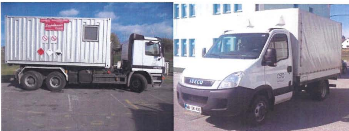
Fotografija 18 in 19: Vozila za prevoz in zbiranje nevarnih odpadkov

Za zbiranje in prevoz nevarnih frakcij uporabljamo specialna vozila, s pokritim kesonom in dovoljenjem za prevoz nevarnih snovi.