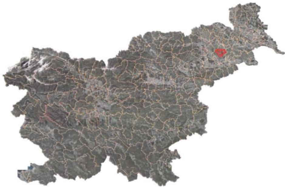
Slika 2: Lega občine Destričnik