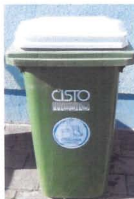
Fotografija 8 in 9: Posode za zbiranje stekla (steklene embalaže)