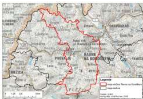
Slika 2: Meja občine Ravne na Koroškem