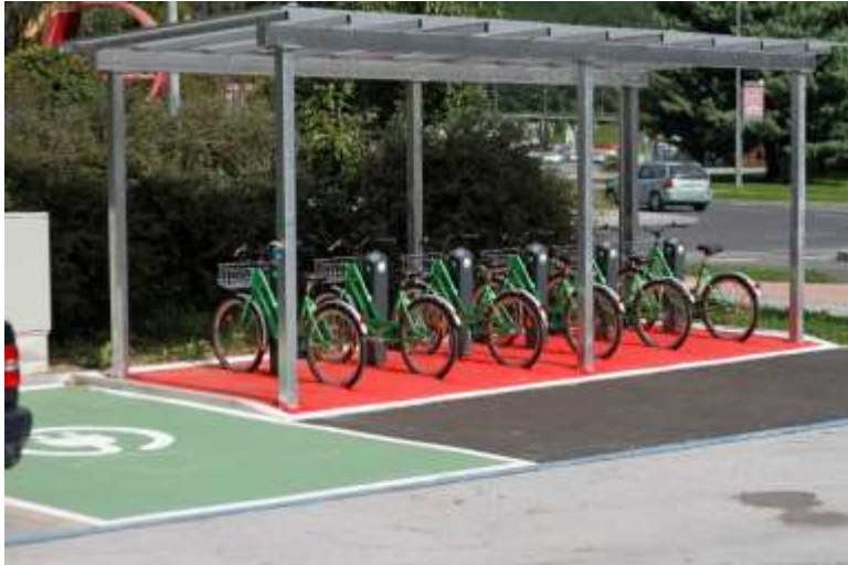
Slika 3: simbolična fotografija postaje s kolesi

Glede na naraščajoče trende v tujini in tudi v Sloveniji želimo tudi na območju občine Ravne na Koroškem postaviti električni polnilni steber , ki je namenjen polnjenju električnih koles, električnih invalidskih vozičkov, električnih skuterjev in ostalih naprav manjših moči. Polnilnica je moderno dizajnirana in zelo enostavna za uporabo. Tudi naša občina želi biti prijazna do okolja in podpira zelena transportna sredstva, med katera sigurno spadajo električna kolesa, ki bodo kmalu prevzela primat med urbaniimi prevoznimi sredstvi.