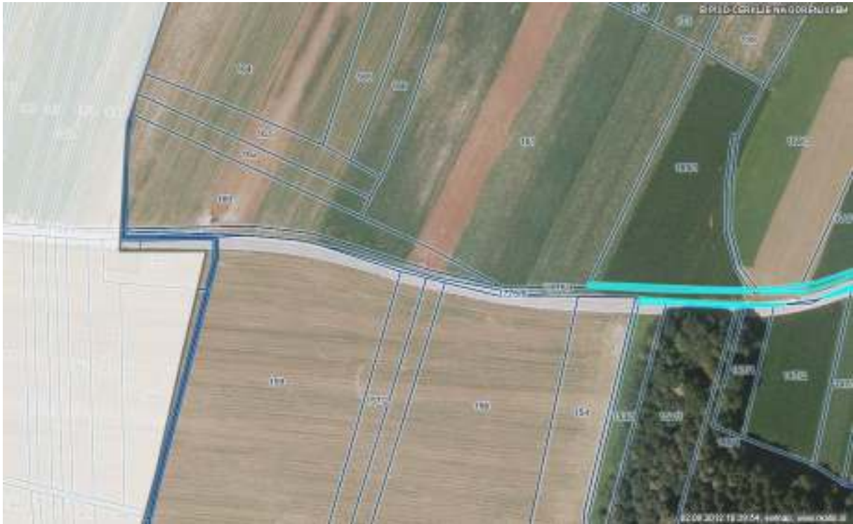
Grafika 4 (zadnji del pri občinski meji z občino Šenčur).

Občinskemu svetu predlagamo, da sprejme naslednji