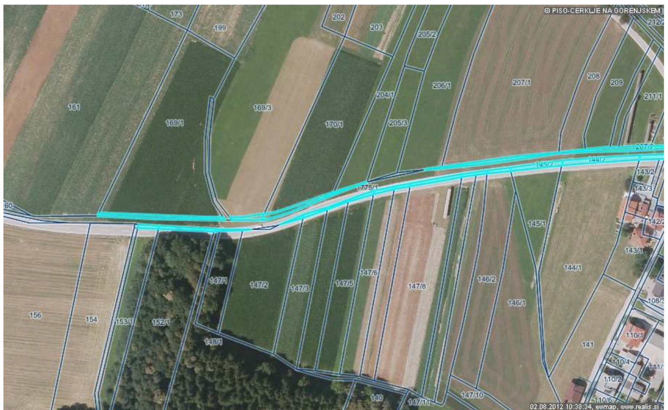
Grafika 3(od naselja Velesovo proti občinski meji z občino Šenčur).