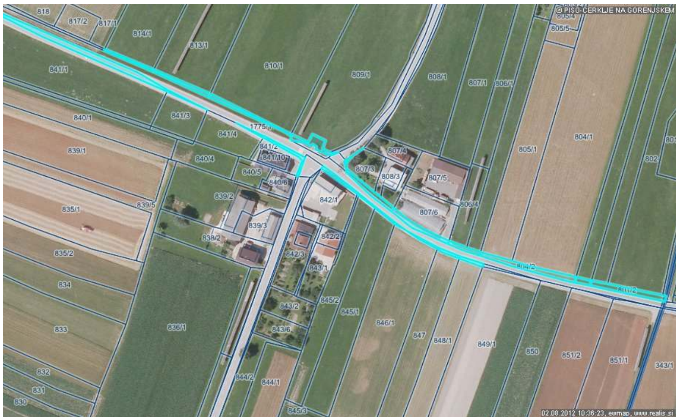
Grafika 1(od katastrske meje Češnjevk – Velesovo do naselja Sp. Trata pri Velesovem) .

OBCINA CERKLJE NA GORENJSKEM - PROSTORSKI INFORMACIJSKI SISTEM - geografski prikaz ( http://www.geoprostor.net/piso ; čas izpisa:02 .avgust 2012, 10:36:23)