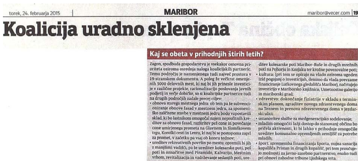
Slika 1: Večer, 2015, 24. 2., str. 19

Mestna občina Maribor je dne 23. 2. 2015 uradno sklenila koalicijsko pogodbo za obdobje 4 let. V koalicijski pogodbi so se partnerji med drugim zavezali, da se bo v skladu s terminskim planom dokončala fizioterapija, da se bo zgradila nova zdravstvena postaja na Teznem in prenovila zdravstvena postaja v Jezdarski ulici.