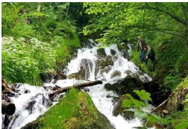
Slapovi na rijeci Jaglenici