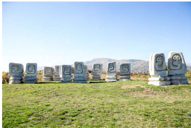
Spomenik žrtvama fašizma "Smrike"