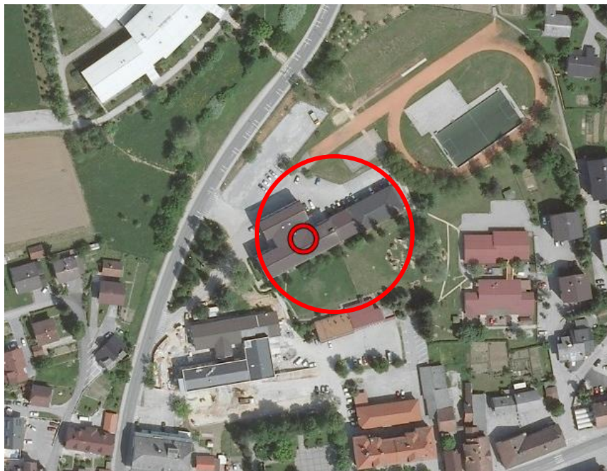
Slika 1: Lokacija objekta