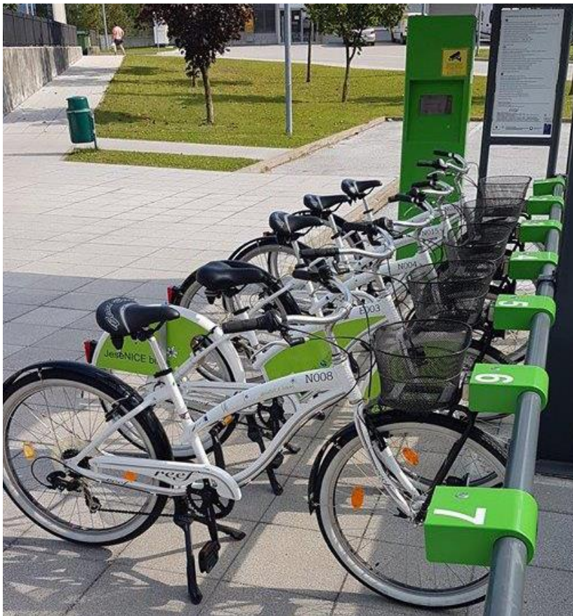
Kolesarnica – simbolična slika.

Z vzpostavitvijo postaj za izposajo koles se bo spodbudila uporaba čistih in energetsko učinkovitih koles ter čistih transportnih sistemov ter odprla možnost razvoja turističnih produktov v navezavi z mobilnostjo.