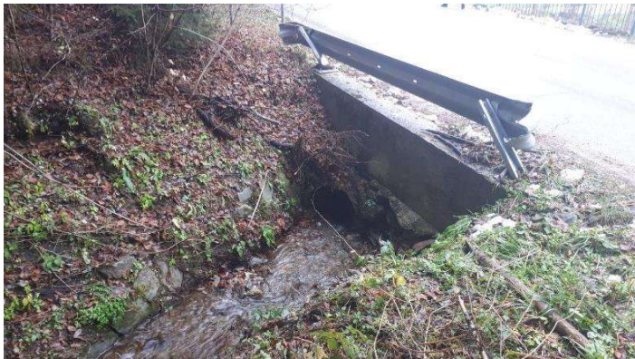
Slika 2: Poškodovanje jeklene varnostne ograje na premostitvi potoka iznad Šentanela–pritok 5

V dneh 22. in 23. junija 2019 je obravnavano območje prizadelo močno neurje s poplavami in točo. Levi pritoki Šentanelške reke so preplavili in erozirali lokalno cesto LC 350361, lokalno so se ustvarili cestni podori, poškodovala se je jeklena varovalna cestna ograja. Investitor, Občina Prevalje, je prijavil dogodek: Močno neurje s poplavami in točo 22. in 23. junija 2019. Škoda je prijavljena v aplikacijo AJDA pod številko vloge iz AJDE: 0043-21428043-05-0003, ID vloge je 1151710. Investitor, Občina Prevalje, Trg 2a, 2391 Prevalje namerava v fazi II. z vzdrževalnimi deli v javno korist sanirati plazove, urediti premostitve treh levih pritokov Šentanelške reke in obnoviti cesto LC 350361, cesta Štopar – Šentanel, ki jo je 22. in 23. junija 2019 prizadelo močno neurje s poplavami in točo, v skupni dolžini 1.138,00 m.