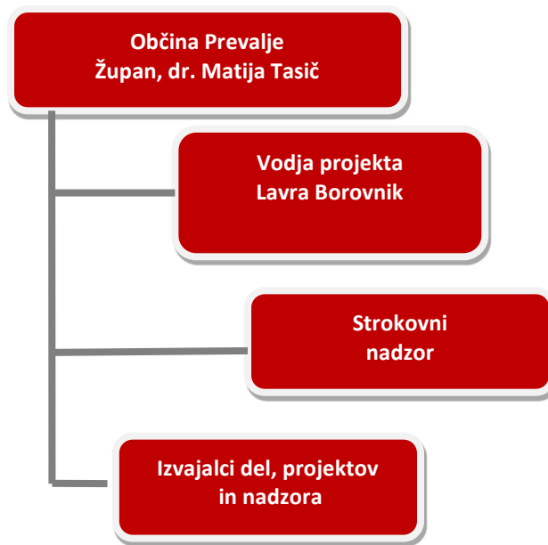
Slika 4: Organizacijska shema sodelujočih v projektni skupini