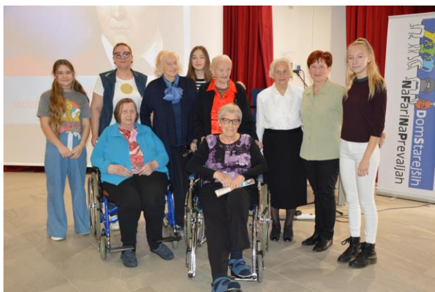
Slika 12: Utrinek iz predstavitve filma

Film si je možno ogledati na spletnih straneh Doma starejših Na Fari in OŠ Franja Goloba Prevalje.