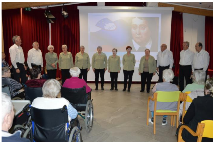
Slika 13: Utrinki iz slovenske predstave ob Slovenskem kulturnem prazniku