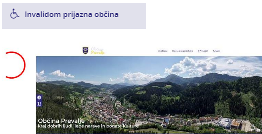
Slika 1: Spletna stran – Invalidom prijazna občina