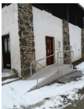
Slika 8: Ureditev klančine

Občina je v letu 2020 v sodelovanju s Krajevno skupnostjo Šentanel izgradila klančino do javnih sanitarij za invalide na Šentanelu.