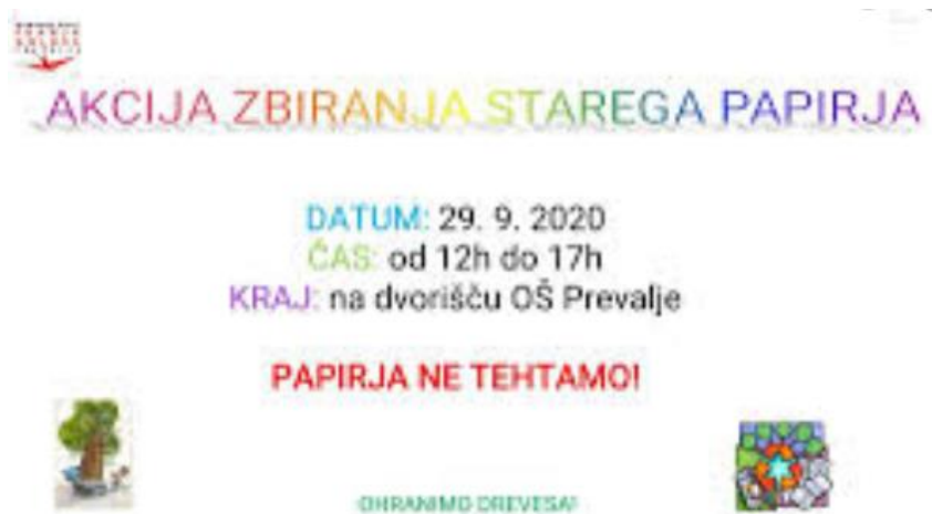
Slika 6: Slika promocijskega plakata za zbiranje odpadnega papirja

Osnovna šola Franja Goloba je v šolskem letu 2020 je izvedla celoletno akcijo zbiranja odpadnega gradiva.