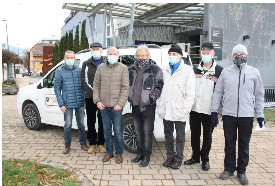
Slika 9: Brezplačni prevozi za starejše občane

Pohvale zadovoljnih uporabnikov potrjujejo in dokazujejo, da je občina skupaj z Združenjem šoferjev in avtomehanikov naredila korak v pravo smer.