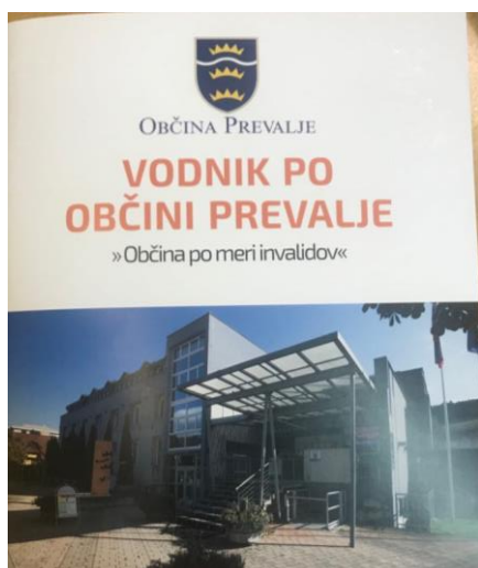
Slika 5: Vodnik po Občini Prevalje

Ker je Vodnik po Občini Prevalje dosegel zelo veliko branost in zanimanje, ga je občina v letu 2020 ponatisnila.