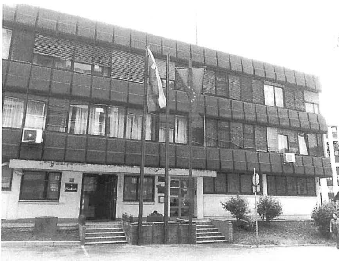
Slika 2. Objekt PP Trbovlje

Objekt Policijske postaje Trbovlje se nahaja na območju KS Franc Fakin, na naslovu Obrtniška cesta 12, Trbovlje, kjer je strnjeno naselje stanovanjskih in poslovnih objektov. Zaradi več poslovnih objektov in dejavnosti ter zgradbe občine (kjer se nahaja tudi upravna enota), se na tem območju v času uradnih ur, občasno nahajajo tudi državljani iz drugih območij regije ali države.