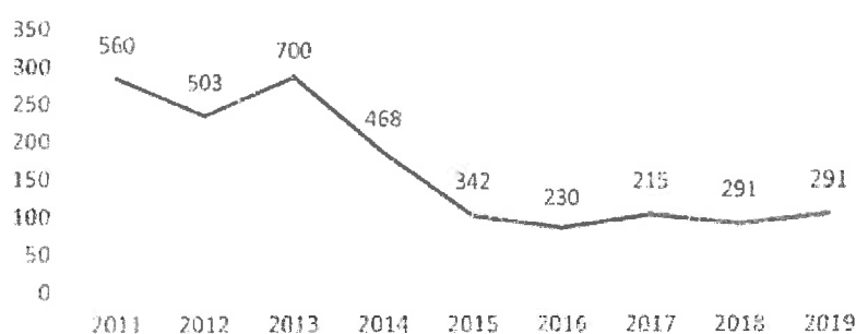
Grafikon 1: Število kaznivih dejanj v obdobju od leta 2011

Število kaznivih dejanj s področja splošne kriminalitete je primerljivo prejšnjim letom, medtem, ko je delež preiskanih kaznivih dejanj na tem področju znašal 65,3 %. Dobro delo na tem področju gre pripisati predvsem stalnemu izobraževanju policistov, opravljanju kvalitetnih ogledov z veliko zavarovanimi sledmi, ter sodelovanju policistov z lokalno skupnostjo (pridobivanje kvalitetnih informacij).