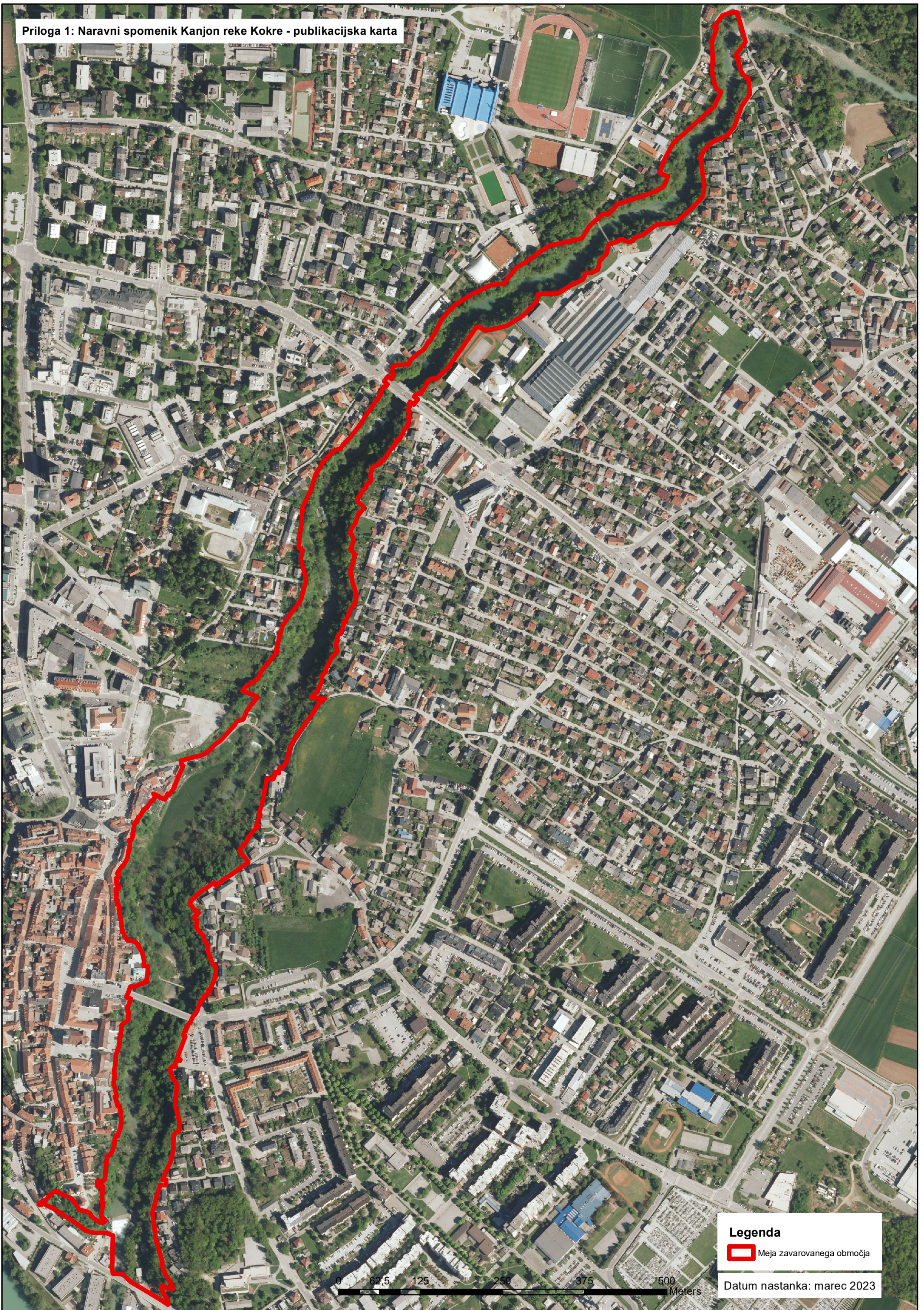
Priloga 1: Naravni spomenik Kanjon reke Kokre - publikacijska karta