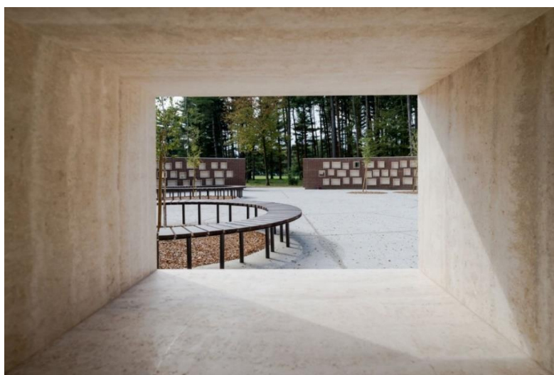
Slika 3: Žarni zid, avtor fotografije Robert Potokar, Virginia Vrecl.