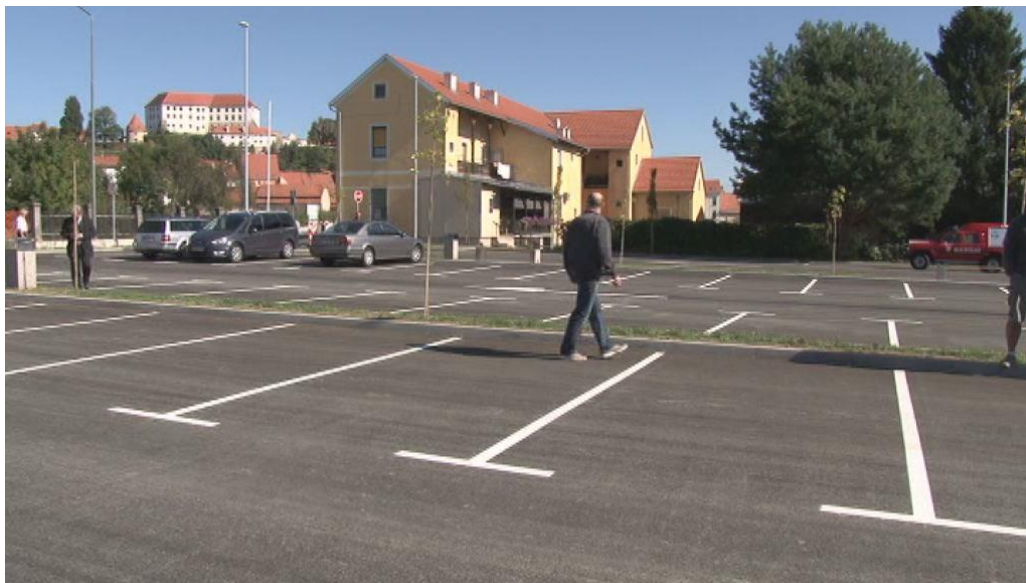
Slika 5: Parkirišče na Zadružnem trgu.