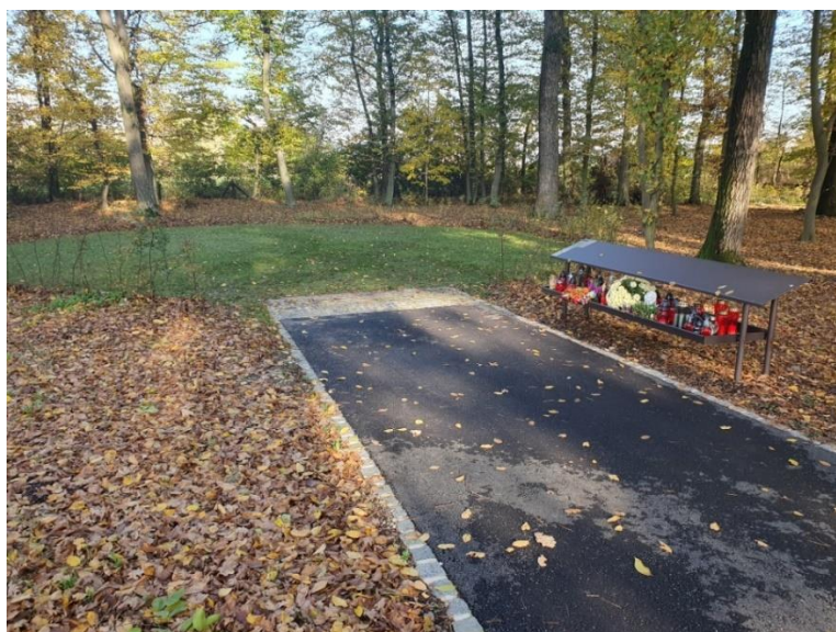
Slika 4: Prostor za posip pepela.