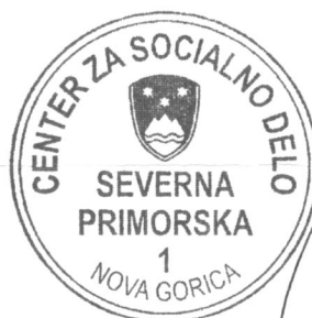
Patricija Može v.d. direktorice

Lepo Vas pozdravljam in želim uspešno delo.