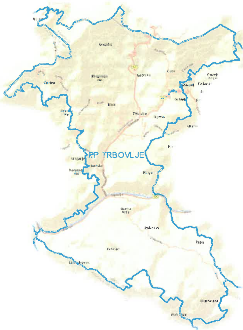
Slika 1: Območje PP Trbovlje

Policijska postaja Trbovlje je ena od 18 območnih policijskih postaj v Policijski upravi Ljubljana. Deluje na območju srednje velike občine Trbovlje, ki se nahaja v zasavski regiji in meji na šest občin, Zagorje ob Savi, Hrastnik, Radeče, Tabor, Prebold in Žalec. S sosednjo občino Zagorje ob Savi je kraj povezan z glavno cesto proti Ljubljani in regionalno cesto preko Slačnika, s sosednjo občino Hrastnik pa prav tako z glavno cesto v smeri Zidanega Mostu in regionalno cesto prek Ojstrškega prevala, ter naselja Čeče. Do občine Prebold je povezava po regionalni cesti preko prelaza Podmeja, kamor se nato dostopa tudi do ostalih sosednjih občin.