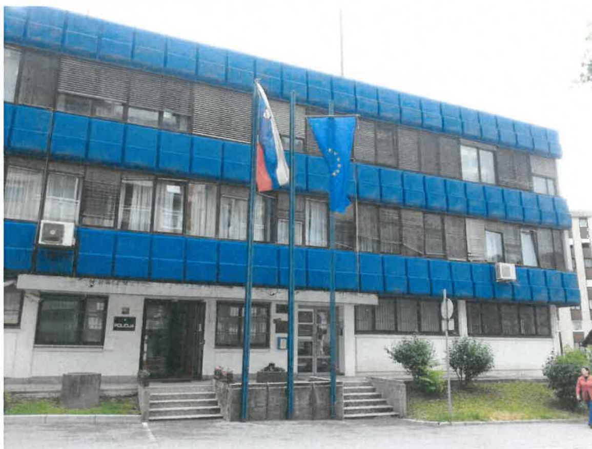
Slika 2: Objekt PP Trbovlje

Objekt Policijske postaje Trbovlje se nahaja na območju KS Franc Fakin, na naslovu Obrtniška cesta 12, Trbovlje, kjer je strnjeno naselje stanovanjskih in poslovnih objektov. Zaradi več poslovnih objektov in dejavnosti ter zgradbe občine (kjer se nahaja tudi upravna enota), se na tem območju v času uradnih ur, občasno nahajajo tudi državljani iz drugih območij regije ali države.