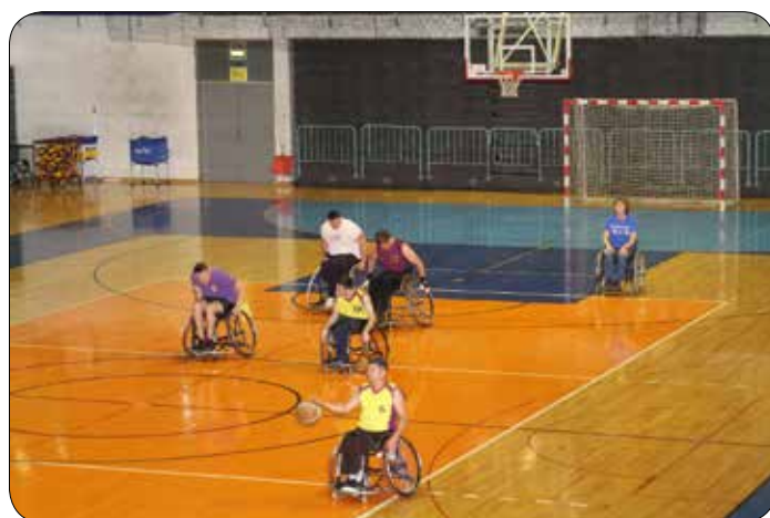
Športne igre invalidov 2019 – Košarka na vozičku

Svet invalidov Mestne občine Maribor je v soboto, 11. 5. 2019, priredil jubilejne, 10. Športne igre invalidov Maribora. Športne igre invalidov so potekale v okviru Športne pomladi 2019 na prizoriščih Športnega parka Tabor Maribor. Letos se je iger udeležilo rekordnih 550 udeležencev. Vsi tekmovalci, nastopajoči v kulturnem programu in prostovoljci so prejeli spominske majice.