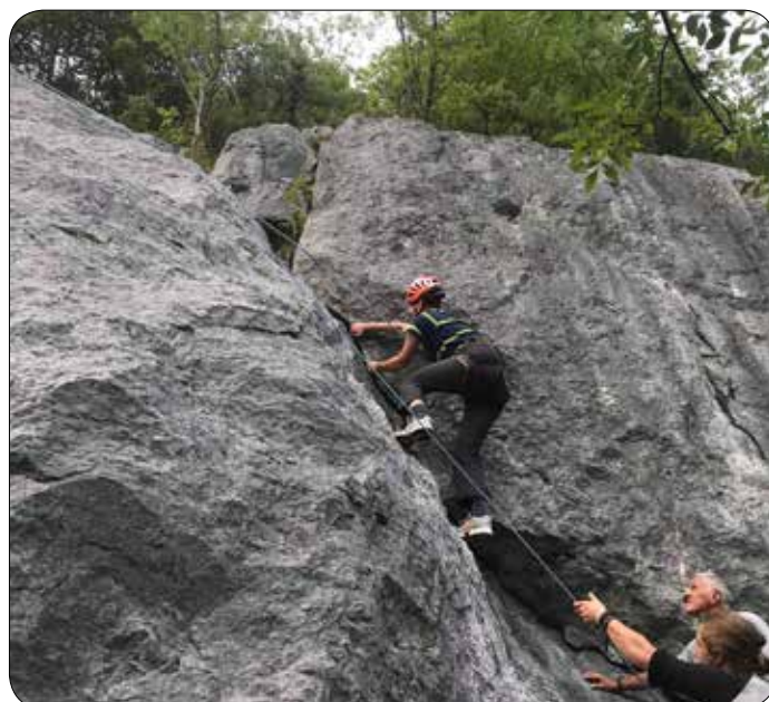
Poskus lomljenja skale

Vedno nasmejani in energični inštruktorji hostla so nam pomagali, da smo se uspešno stlačili v neoprenasta oblačila, rešilne jopiče in čelade. Vesla v roke in pogumno, sprva po jezeru in nato po Savi Bohinjki navzdol. Deležni smo bili natančnih navodil, kako in kaj, a smo kljub temu nekateri pogosto odtavali kar po svoje. Prava akcija se je pričela, ko smo zapustili jezero in se spustili po reki, po brzicah. Nekateri je sprva razžiral dvom in strah. Je strmo? Mogoče preveč deroče? Bom zmoget? Dokler ne poskusiš, ne boš nikoli izvedel. Ko smo drveli po prvih brzicah, imeli vodne »vojne« in skakali z več metrov visokega klifa v globok tolmun, smo pozabili na strah, dvome in nezaupanje. Vse to je splavalo naprej po vodi, vse do Črnega morja. Medtem ko je ena skupina preskušala meje svojih sposobnosti, je druga na plaži testirala kajake, kanuje in SUP-e. Nekateri pa so preprosto plavali ali se sončili na brisači. Karkoli te osrečuje. Adrenalin iz brzic in tolmunov smo uspešno prenesli na steno. Trdno smo pripeli varnostne pasove, nataknili čelade, zategnili vezalke in se spoprijeli z razpokami, previsi in vdolbinami. Nekateri vse do vrha, drugi par metrov, a vsi zagotovo zmagovalci.