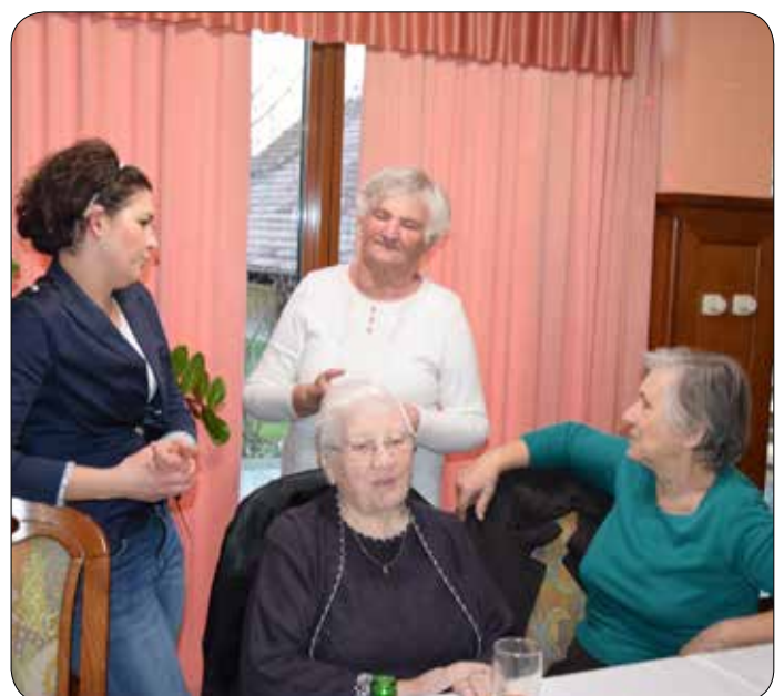
Članice med pogovorom