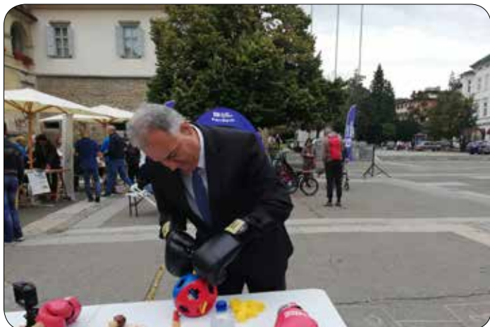
Dan mobilnosti invalidov 2019 – dogajanje na Trgu svobode

Sočasno je potekal tudi inkluzijski sprehod med zanimivimi drevesi v Mestnem parku, ki je bil izveden v organizaciji in sodelovanju Planinskega društva Maribor Matica in Hortikulturnega društva Maribor. Udeležilo se ga je okoli 60 oseb. Sočasno so se kolesarji v spremstvu in pod vodstvom predstavnikov Mariborske kolesarske mreže udeležili 10 km dolge krožne vožnje po Mariboru. Kolesarji so uporabljali različna kolesa, od navadnih do prilagojenih. Vsi sodelujoči na sprehodu in na kolesarski turi so bili zelo zadovoljni z izvedbo aktivnosti in si želijo več podobnih dogodkov.