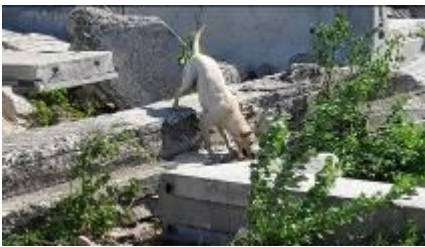
Trening v Tritolu, maj 2019