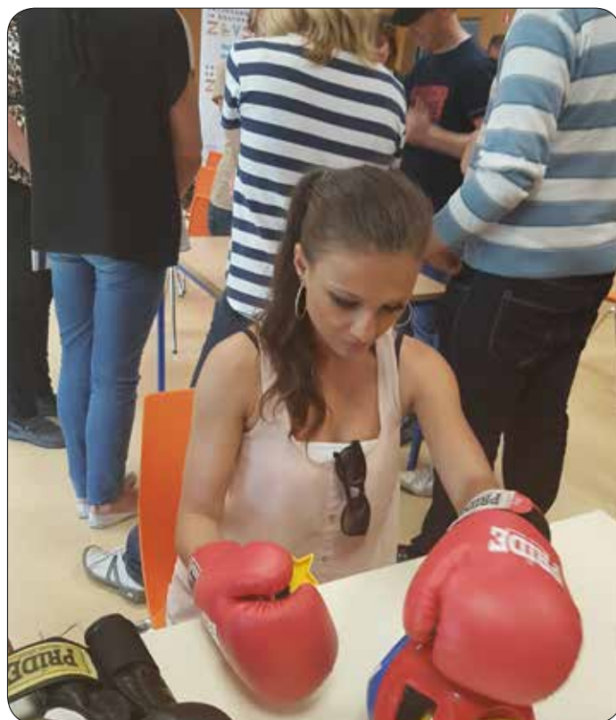
Izkušnja spreminja v Slovenj Gradcu

V sklopu projekta smo se s profesionalnim fotografom učili, kako fotografirati. To nam je prišlo zelo prav, ko smo proti koncu naše izmenjave odšli na izlet v najmanjšo bolgarsko vasico, kjer smo preživeli krasen dan. Obiskali smo vinsko klet, poskusili kvalitetno vino in tradicionalno bolgarsko hrano ter spoznali zgodovino vasice. Naša naloga po končanem izletu je bila ustvariti zgodbo, ki bo zajemala tudi materialno gradivo v namen objave našega izdelka. Nastale so resnično prave umetnine, saj smo do tedaj že obvladali in upoštevali pravila dobre zgodbe, pa tudi timsko smo se že kar dobro ujeli. Izkušnja nas je povezala, spoprijateljila, naučila zaupanja in nas za vedno opremila z bogatim znanjem in novimi prijatelji. Zadnji dan smo se z avtobusom odpravili na letališče v Sofiji, kjer smo se poslovili in odleteli nazaj v Slovenijo.