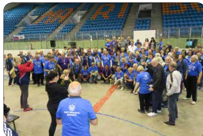
Športne igre invalidov 2019 – Prejemniki odličij