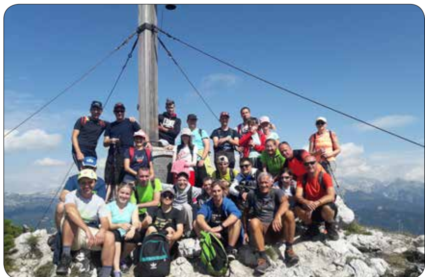
Leseni križ na Voglu