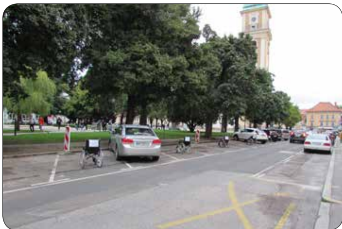
Dan mobilnosti invalidov 2019 – akcija Pridem takoj

V Svetu invalidov Mestne občine Maribor smo prepričani, da je umestitev športa invalidov v nacionalni sistem športa in rekreacije državnega pomena in da so takšni posveti zelo dobrodošli, saj ponujajo možnosti razvoja, spodbujanje športnega vključevanja in medsebojnega sodelovanja, z namenom, da se spremeni pogled na šport invalidov ter da se hkrati ozavešča širša javnost, posledično pa se razbijajo tabuji o vključevanju mladih invalidov v šport. Hkrati vidimo priložnost za sodelovanje in razvoj novih športnih programov tudi v Društvu gluhih in naglušnih Podravja Maribor, v katerem smo zelo ponosni, da nam je Mestna občina Maribor skupaj z Uradom za šport MOM in Športno zvezo Maribor že več let zaporedoma podelila plaketo zaslužni organizaciji na področju športa, s čimer je vsakokrat nagradila prizadevanja našega društva za uspešno spodbujanje športa invalidov, kar je velika spodbuda za delo naprej.