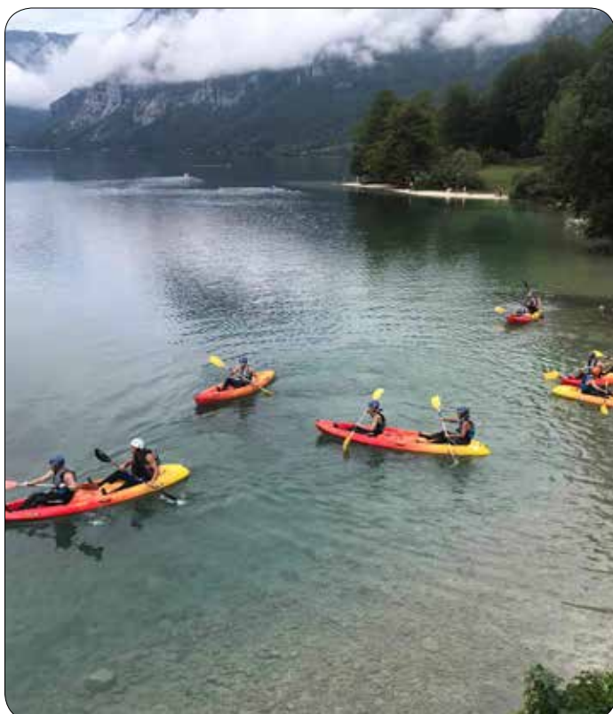
Tik pred spustom po brzicah Save Bohinjke

Medtem ko je na jezeru potekal triatlon in so se tekmovalci za začetek spopadli s kajaki in SUP-i, smo mi vse to opazovali s sedežev naših koles. Mirno, v koloni smo kolesarili po uradni trasi tekmovanja, vse do Bohinjske Bistrice in še malo. Teka si ravno nismo organizirali, smo si pa omislili še pot okoli jezera. Vseh 13 km nam je uspelo prehoditi brez omembe vrednih žrtev s postankom v prijetno ohlajeni cerkvi sv. Janeza Krstnika. Tako smo na nek način uspeli opraviti svoj lastni triatlon, sicer ne vse v enem dnevu, vendar kljub temu – spoštovanja vredno. Še več, mi se nismo zadovoljili samo s tremi disciplinami. Na popularnosti so zagotovo najbolj pridobili skoki v vodo. S SUP-om do bližnjega pomola, vzpon na pomol in skok na noge. Bravo! Bi še?