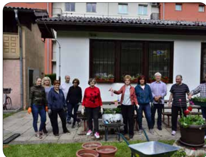
Prostovoljke in prostovoljci skrbimo za lepo urejeno okolje društva Dom

Naše dvorišče je dobilo pravo pomladno podobo. Tam člani preživljamo prijetne dopoldneve ali popoldneve, ko so na sporedu različne aktivnosti – največkrat, ko so kuharske delavnice ali športno-rekreativne dejavnosti, kot so pikado, rusko kegljanje –, toplo sonce pa članice in člane zvabi na prosto na telovadbo. S pomladnim soncem se iz mrzlih zimskih dni prebujamo tudi mi in s prostovoljno akcijo poskrbimo