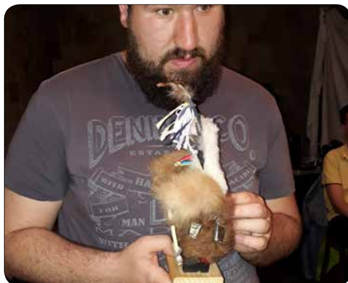
Slep udeleženec si s tipom ogleduje kurenta