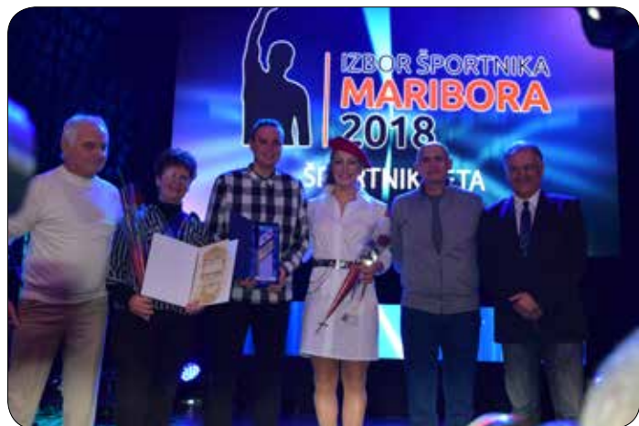
Predstavniki društva gluhih in naglušnih z Ilko Štuhec, športnik leta 2018

29. 1. 2019 je v hotelu Habakuk potekala slavnostna prireditel Športnik leta 2018. V organizaciji Mestne občine Maribor, Urada za šport MOM in Športne zveze Maribor so podelili priznanja najboljšim športnikom v mestu Maribor. O prejemnikih priznanj, ki jih podeljujejo že od leta 1973, so odločali glasovi članov strokovnega sveta Športne zveze Maribor in športnih novinarjev mariborskih medijev. Nagrajeni so bili najuspešnejši športniki posamezniki, klubi, trenerji in drugi športni delavci v mestu.