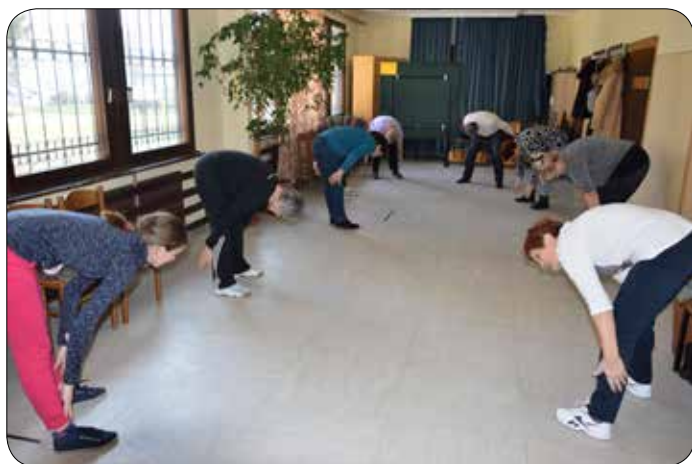
Telovadba za zdravje v veliki sobi društva Dom

S svojimi pričevanji in izkušnjami drugih, ki poročajo o številnih pozitivnih učinkih vsakodnevne vadbe, so me navdale z navdušenjem, zato sem se jim pridružila. Poleg organizirane vadbe na prostem sem se začela udeleževati tudi predavanj o zdravem načinu življenja in vplivu telovadbe na telo. Spoznala sem pozitivno reakcijo mojega telesa.