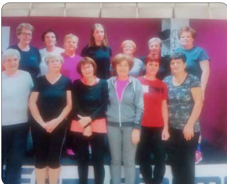
Telovadke (arhiv društva)