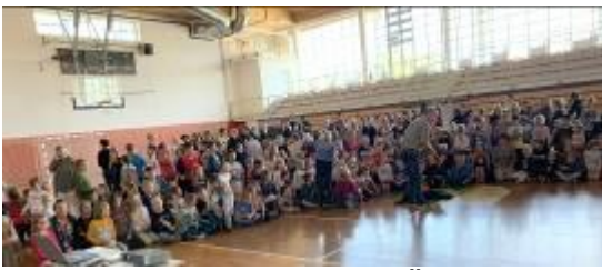
Predstavitev za 450 otrok OŠ Benedikt, oktober 2019

Znatno podporo so prejeli tudi s strani medijev z objavo več člankov in TV prispevkov (Radio City, Utrip Oplotnica, Večer, POP TV, Planet TV, Radio Caprice, revija Paraplegik...). Spremljali so aktivnosti ob mednarodnem dnevu psov vodnikov, mednarodnem dnevu bele palice, mednarodnem dnevu invalidov. Izdali so koledar 2020 in imeli foto razstavo na temo Šapice z razlogom v UKC Maribor-pediatrija, fotografa Darka Novaka.