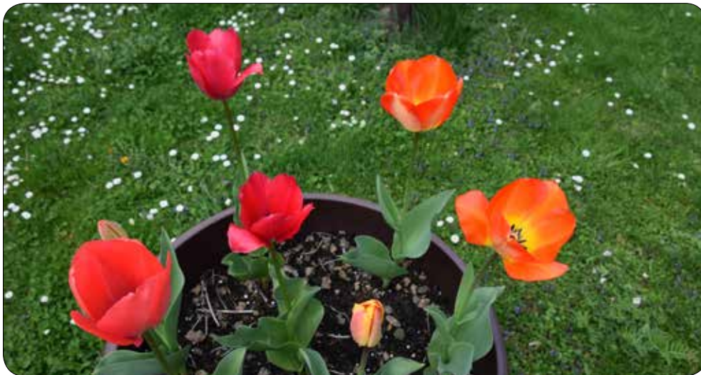
Tulipani so se razcveteli na dvorišču društva Dom