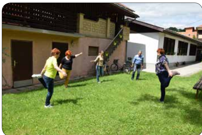
Telovadba na dvorišču

Večkrat sem jih že opazila nasmejjane gospe, ki so po jutranji telovadbi na prostem odhajale dnevu naproti. Priznam, budile so mi radovednost, kdo so ti ljudje, ki ne glede na letni čas in vreme vztrajno skrbijo za telo in obenem tudi za duha. Da jim taka vrsta druženja prinaša same dobre stvari, je bilo moč videti že na njihovih obrazih in večkrat me je zamikalo, da bi se jim pridružila. Sama se čutila potrebo, da nekaj spremenim v svojem načinu življenja in izboljšam zdravstveno stanje. Bolečine v okončinah in težko gibljivost sem že nekaj časa le s težavo prenašala.