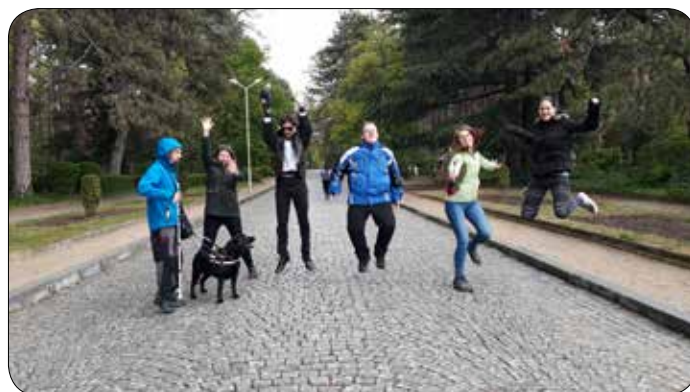
Slovenski udeleženci izmenjave pozirajo na delavnici fotografiranja