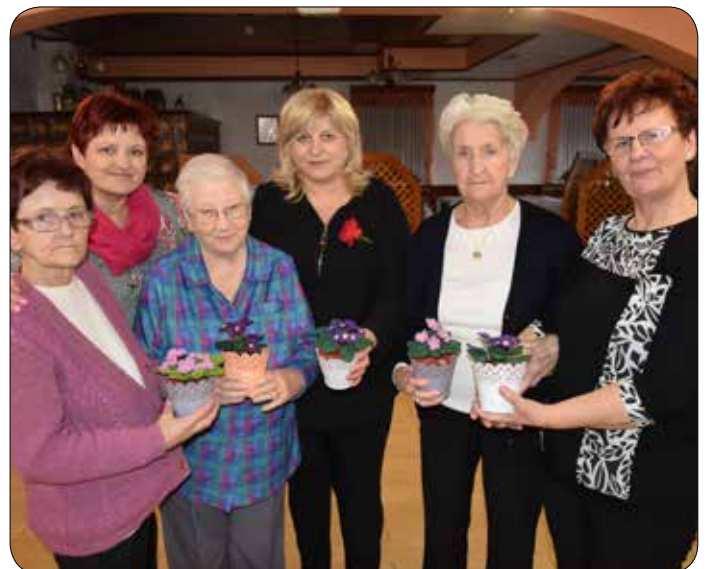
Obdarovanje je vedno lepo

za nove rožice in urejanje okolja na dvorišču. Občudujemo prvo cvetje na gredicah in zelenici. Vidimo veliko drobnih ptic in skušamo skozi njihove gibe in razigranost prepoznati pesem ptic. Tudi prvi rumeni in beli metuljčki so razprli krila in poplesujejo na zeleni trati ter posedijo na živobarvnih cvetovih. Tako opazovanje narave in druženje s prijatelji iz društva ti da veselje, da bi kar sam poletel kot metulj.