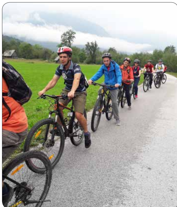
S kolesi do Bohinjske Bistrice in nazaj