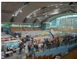
Karierni sejem 2019

Na sejmu je sodeloval tudi Svet invalidov Mestne občine Maribor in vključena invalidska društva.