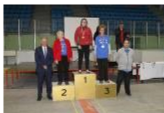
Športne igre invalidov 2019