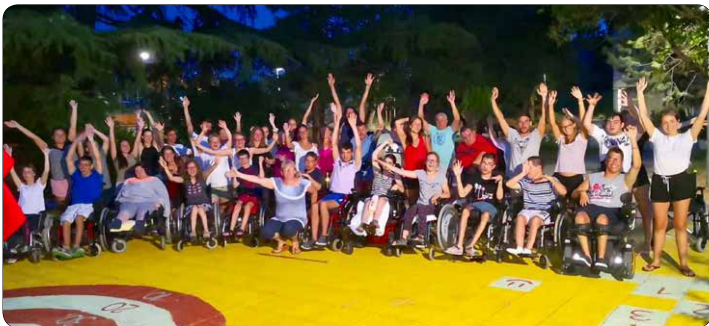
Zdravstveno-terapevtska kolonija na Debelem rtiču