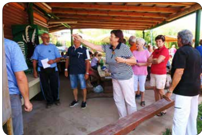
Pikado na Športno-rekreativnem srečanju invalidov 2019

DS za šport in rekreacijo Sveta invalidov Mestne občine Maribor je v sodelovanju z Zvezo društev ŠMIRIS 30. 8. 2019 na ŠRC Fontana Maribor organizirala že šesto Športno-rekreativno srečanje invalidov Maribora. Sodelovalo je rekordnih 120 članov iz 10 mariborskih invalidskih društev. Prireditve se je udeležilo tudi 6 povabljenih gostov.