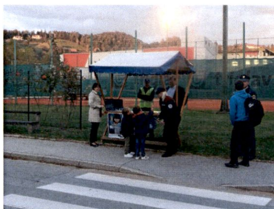
Sodelovanje s SPVCP in PP