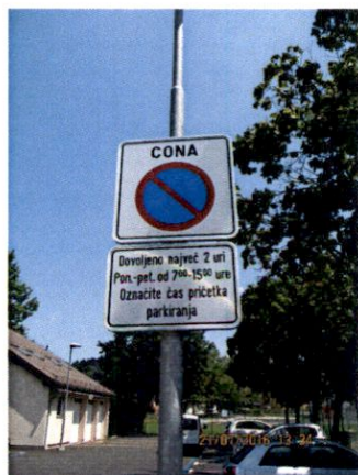
Uvajanje novega prometnega režima