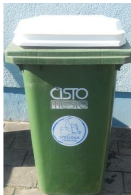
Fotografija 8 in 9: Posode za zbiranje stekla (steklene embalaže)