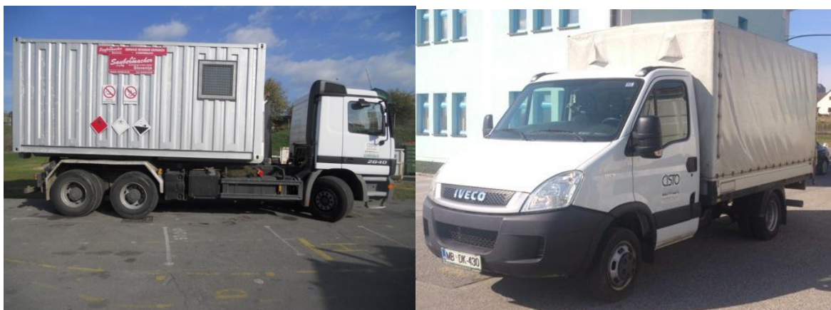
Fotografija 18 in 19: Vozila za prevoz in zbiranje nevarnih odpadkov

Za zbiranje in prevoz nevarnih frakcij uporabljamo specialna vozila, s pokritim kesonom in dovoljenjem za prevoz nevarnih snovi.