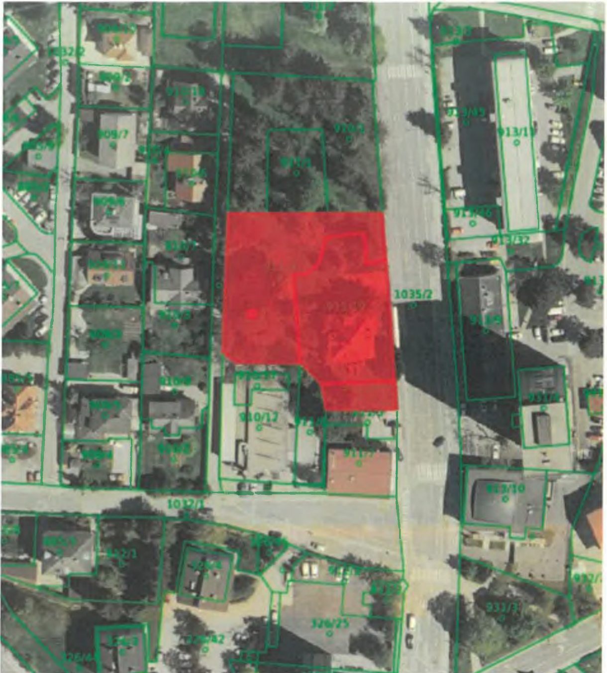
stavba št. 79 k.o. Kranju s pripadajočimi zemljišči, parc. št. 911/19, 911/18 in 911/4 k.o. Kranj