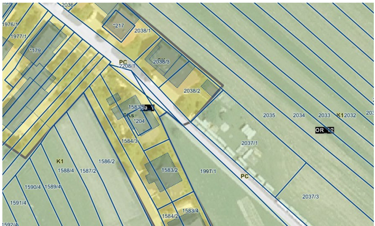
OPN Ribnica - območje stavbnih zemljišča in meja ureditvenega območja

Sedanja meja ureditvenega območja je določena v omenjenem OPN in poteka ob sv in jv robu investitorjeve zemljiške parcele, neposredno ob obstoječih objektih.