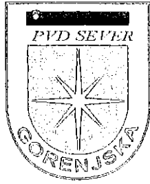
Odbor Škofja Loka