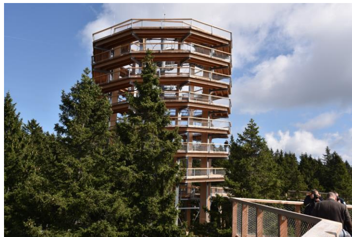
Slika 6: Razgledni stolp poti med krošnjami

Ob podpisu stavbne pravice z investitorjem Stezka Korunami D. je bilo dogovorjeno, da bo Občina Zreče zagotovila vso potrebno komunalno infrastruktura s priključnimi mesti v neposredni bližini vstopnega objekta. Izvedel se je priključek za vodo in TK, elektriko, fekalno kanalizacijo vse za namen obratovanja vstopnega objekta na Pot med krošnjami Pohorje. Prav tako smo še izvedli odvodnjavanje dostopne ceste in parkirišča ter zgradili dostopno cesto, parkirišče in pešpot do vstopnega objekta. Skupna vrednost izvedene komunalne infrastrukture z dostopi in parkirišči je financirala Občina Zreče iz svojega proračuna v višini 142.254,58 EUR. Prav tako pa smo še financirali potrebno projektno dokumentacijo za izvedbo prej navedenega v višini 8.210,60 EUR in gradbeni nadzor v višini 8.784,00 EUR. Tako je Občina Zreče vložila v ta projekt sredstva v skupni višini 159.249,18 EUR.