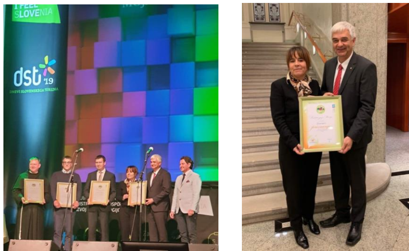
Sliki 2 in 3: Utrinka s podelitve

Za osvojeno priznanje gre zahvala vsem deležnikom na destinaciji in občanom ter predstavlja odlično motivacijo tudi za delo v prihodnje.