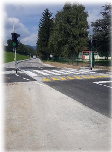
Slika 10: Zgrajen nov prehod za pešce

Semafor ima tipko na poziv ter odštevalnikom časa zelenega in rdečega vala. Na območju čakanja smo vgradili taktilni sistem za vodenje slepih in slabovidnih.