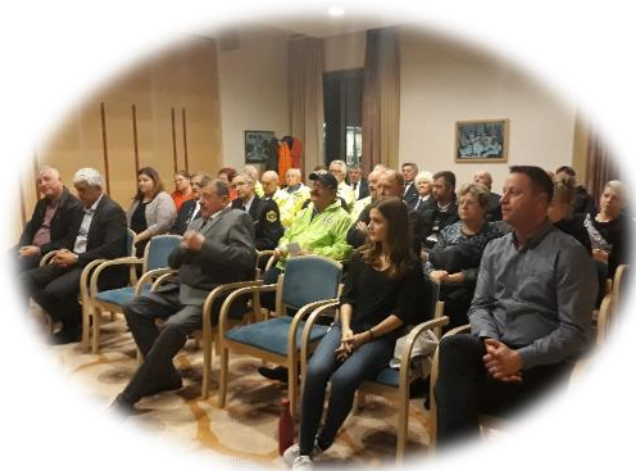
Slika 11: Utrinek z osrednjega dogodka

Pripravila: Simona Črešnar, svetovalka za cestno gospodarstvo