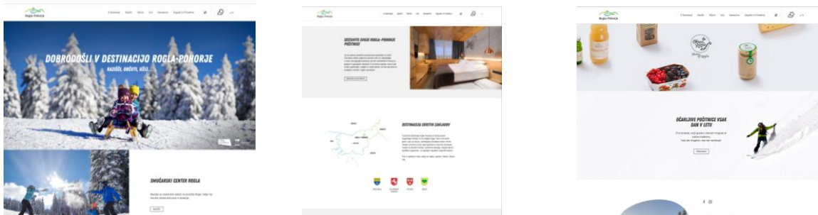
Slike 14, 15 in 16: Nova destinacijska spletna stran

Skupen destinacijski film in filme po občinah najdete na YouTubu, na povezavi https://www.rogla-pohorje.si/sl/video/ , nova spletna stran destinacije pa je www.rogla-pohorje.si .