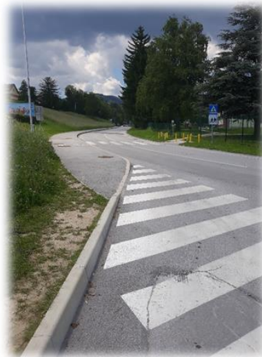
Slika 9: Prehod pred izgradnjo

»Naložbo v višini 39.741,74 EUR sofinancirata Republika Slovenija in Evropska unija iz Kohezijskega sklada v skladu z Operativnim programom Evropske kohezijske politike za obdobje 2014 - 2020«, prednostne osi 4 »Trajnostna raba in proizvodnja energije in pametna omrežja«, tematskega cilja 4 »Podpora prehodu na nizkoogljično gospodarstvo v vseh sektorjih«, prednostne naložbe 4.4 »Spodbujanje nizkoogljičnih strategij za vse vrste območij, zlasti za urbana območja, vključno s spodbujanjem trajnostne multimodalne urbane mobilnosti in ustreznimi omilitvenimi prilagoditvenimi ukrepi«, specifičnega cilja 1 »Razvoj urbane mobilnosti za izboljšanje kakovosti zraka v mestih.«