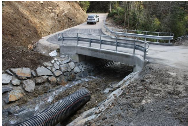
Slika 5: Most na Ločnici

Dela na mostu so tudi dokončana, prav tako pa je urejena struga gor in dol vodno od mostu, za kar imamo kot soinvestitor z Direkcijo RS za vode kot upravljavcem, Dravo, VGP Ptuj, d.o.o. kot koncesionarjem sklenjeno pogodbo o ureditvi medsebojnih razmerij zaradi financiranja vzdrževalnih del na Ločnici, v sklopu katerih se je zavarovanje izvedlo. Vrednost del po pogodbi in sklenjenimi aneksi znaša 48.367,50 EUR, od tega znaša občinski delež 18.310,91 EUR.