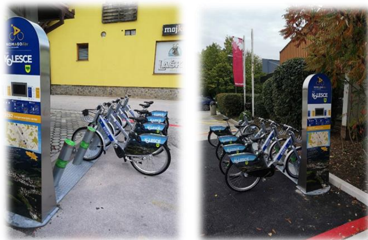
Sliki 7 in 8: Kolesa pri VGC Zreče in pred Občino Zreče

Kolesa s terminali smo postavili na 4-ih lokacijah, in sicer: pri Občini Zreče, pred hoteli Dobrava, pri Uniorju in pri Večgeneracijskem centru. Za uporabo je na voljo 10 navadnih koles in 4 električna. Vsak termin je opremljen s štirimi stojali za klasična kolesa in dvema stojaloma za električna kolesa.