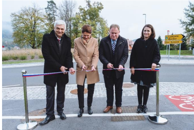
Slika 19: Prerez traku ob otvoritvi novozgrajenega krožišča

Ozzing d.o.o. je v letu 2017 izdelal novelacijo projektne dokumentacije PZI »Rekonstrukcija križišča »Zreče« na regionalni cesti R3-701/1430 Pesek – Rogla – Zeče, v km 20,040«. Pogodba za izvedbo del je bila podpisana z najugodnejšim izvajalcem TEGAR d.o.o., Žalec in podizvajalcem ASFALTI Ptuj d.o.o.. Pogodbena vrednost del je 402.289,24 EUR z DDV. Sofinancerski delež Občine Zreče pa je v višini 71.425,23 EUR z DDV.