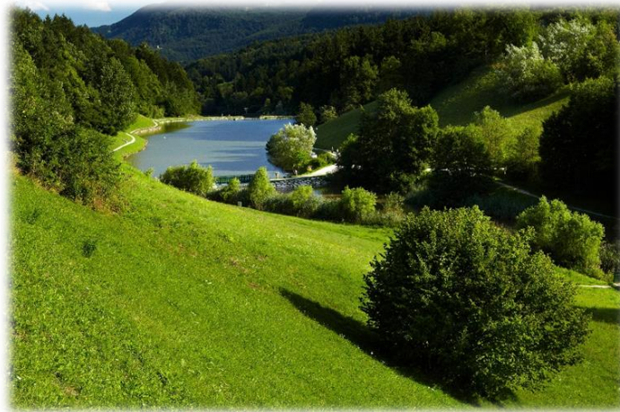
Slika 1: Zreško jezero

Zreški turizem temelji na zdravem in čistem zraku ter okolju, ki ga soustvarjajo obsežni gozdni kompleksi in višja nadmorska višina. Rogla kot svetovno znana turistična destinacija, privablja veliko obiskovalcev in za območno trajnostno razpršitev turizma želi Unitur d.o.o. ponuditi domačinom in obiskovalcem tudi Zreško jezero, ki sedaj ni urejeno kot turistična destinacija. Zasnovati želimo nov model razvoja turizma ob Zreškem jezeru, ki bo dopolnjeval termalno ponudbo Zreč, ter ponudbo Rogle in istočasno rešil sedanje stanje.