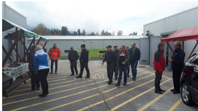
Slika 18: Utrinek z dnevnega odprtja vrat na ČN Zreče

Zaposleni na čistilni napravi smo navdušeni nad odzivom in upamo, da se naslednje leto na sedmi obletnici delovanja čistilne naprave zopet vidimo in podružimo. Tudi v časopisu Novice so se pošalili na naš račun z izjavo »Kdaj veš, da čistilna naprava deluje? Ko lahko pred njo poješ kanapejček.«.