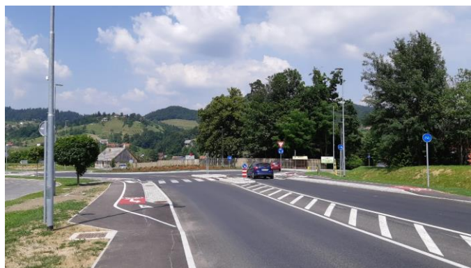
Slika 20: Novo krožišče pri SPAR-u

Občina Zreče je še financirala izvedbo nadzora v višini 3.066,11 EUR, razliko v materialu granitnih kock in robnikov v višini 11.801,83 EUR, izdelavo projektne dokumentacije za prestavitev NN elektro kablovoda v višini 3.675,00 EUR, hortikulturno ureditev samega otoka krožišča (dokumentacija in izvedba) v višini 12.486,55 EUR ter ureditev začasne JR in pregled obstoječe meteorne kanalizacije v skupni višini 1.599,00 EUR. Tako je Občina Zreče financirala še dodatno sredstva v višini 32.628,49 EUR, torej skupaj v izgradnjo krožišča v višini 93.923,84 EUR.