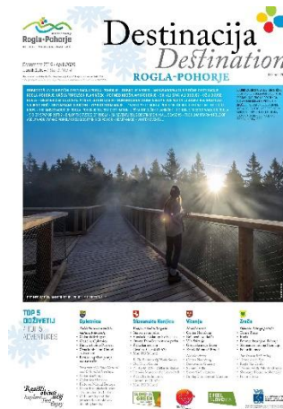
Slika 17: Destinacijski časopis