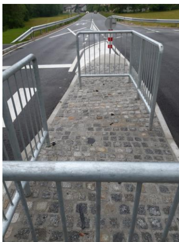
Slika 21: Hodnik za pešce ob regionalni cesti Stranice – Višnja vas

celoti pokrila Direkcija RS za infrastrukturo. Občina Zreče pa je pokrila izvedbo dveh fekalnih kanalizacijskih priključkov, eden preko regionalne ceste in eden preko potoka Tesnica v skupni vrednosti 9.430,58 EUR. Dela so se zaključila dne 15. 4. 2019. Komisijski ogled s strani investitorja DRSI pa je bil izveden 26. maja 2019.