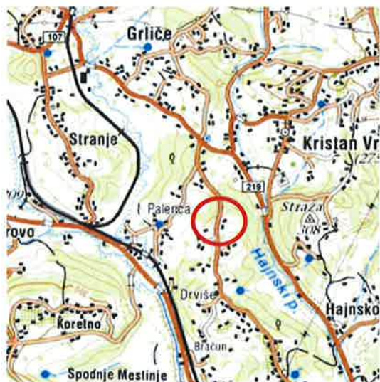
Slika 2: širši prikaz v prostoru – topografija (vir: www.geopedia.si )