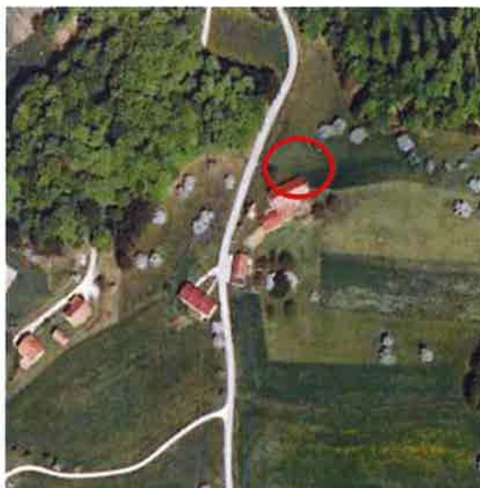
Slika 3: širši prikaz v prostoru – digitalni ortofoto posnetek