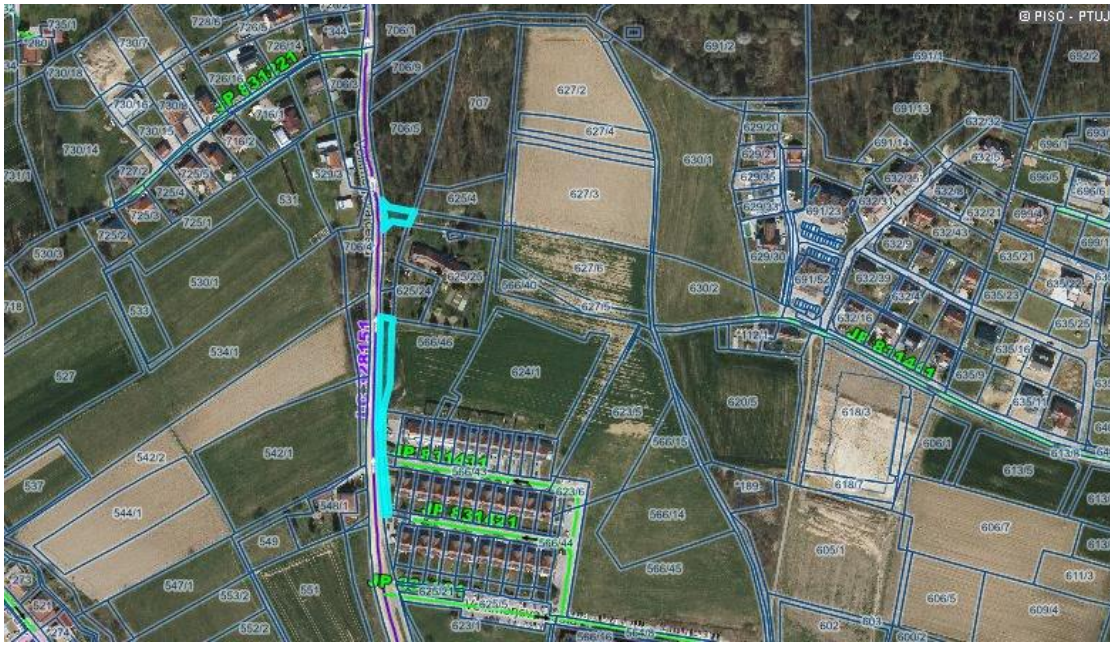
Prikaz trenutnega stanja nepremičnin.