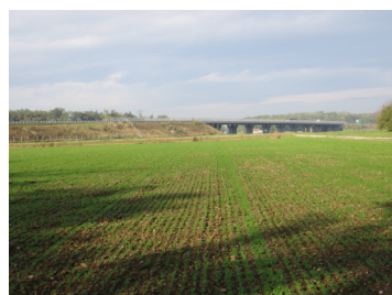
Slika 5: Viadukt Zgornja Hajdina