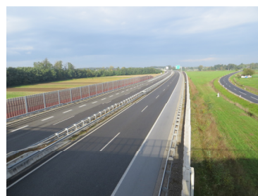
Slika 6: Pogled iz Selske ceste