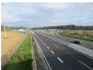
Slika 3: Počivališče Dravsko polje

Izgradnja avtoceste na odcepu Slivnica-Draženci je s svojo izgradnjo leta 2009 bistveno pripomogla k razbremenitvi prometa po obstoječi glavni cesti G1-1 in G1-9 Maribor-Hajdina-Macelj in tako omogočila dokaj normalno življenje občanom naselij Slovenja vas, Hajdoše, Skorba in Spodnja Hajdina, ki živijo tik ob trasi ceste. Zgrajeni avtocestni odsek Slivnica - Draženci je dolg 19,85 km, začne se v razcepu Slivnica na mestu križanja z avtocesto A1. V nadaljevanju poteka južno od letališča Edvarda Rusjana Maribor proti zaselku Hotinjska Agrarna. Tu zavije proti vzhodu in poteka južno od zadnjih signalnih naprav letališča in naprej mimo Rač. Na severni strani naselja Marjeta na Dravskem polju se avtocesta obrne proti jugu, teče med naseljema Gerečja vas in Kungota pri Ptujju, kjer se trasa obrne proti jugovzhodu pod naselje Hajdina in v nadaljevanju prečka železniško progo. Na koncu se s košarasto krivino vklopi v obstoječo traso glavne ceste G1-9 vzhodno od Dražencev. Za dobro povezanost z ostalimi cestami in naselji so zgrajeni priključki Letališče Maribor, Marjeta, Zlatoličje in Hajdina, preko razcepa Draženci pa poteka tudi navezava na glavno cesto G1-2 Ptuj-Ormož.