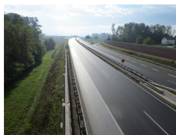
Slika 4: Razcep Draženci