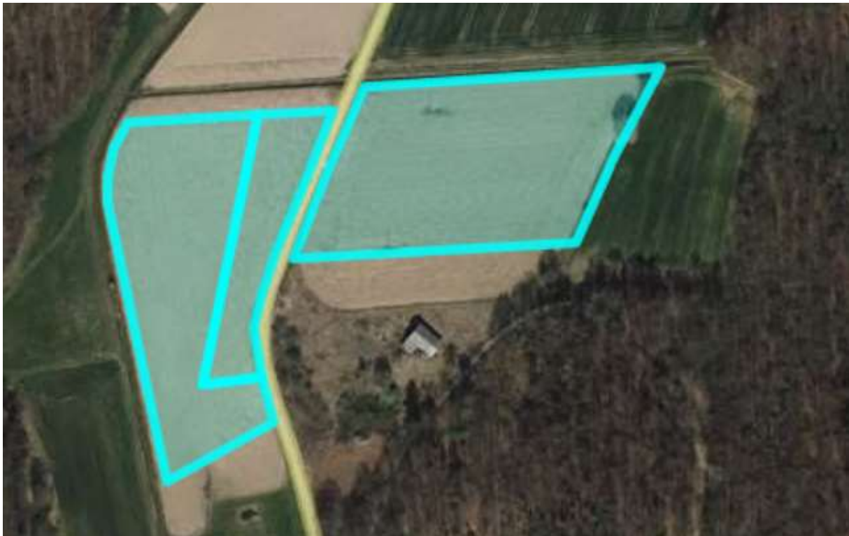
Brezplačna pridobitev nepremičnine - parc. št. 612/2 k. o. Prerad