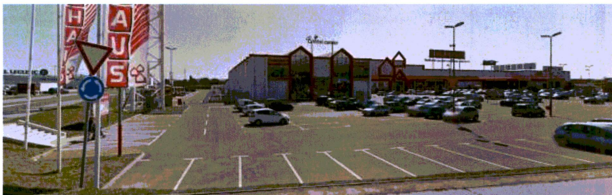
Pogled na območje z zahodne strani

Območje načrtovanja leži v južnem delu mesta Maribor, med Tržaško cesto na zahodu in železniško progo E 67 Šentilj-Maribor–Zidani most na vzhodu, v širšem pasu ob Cesti na Ledine. Na obravnavanem območju je zgrajen trgovski objekt Bauhaus