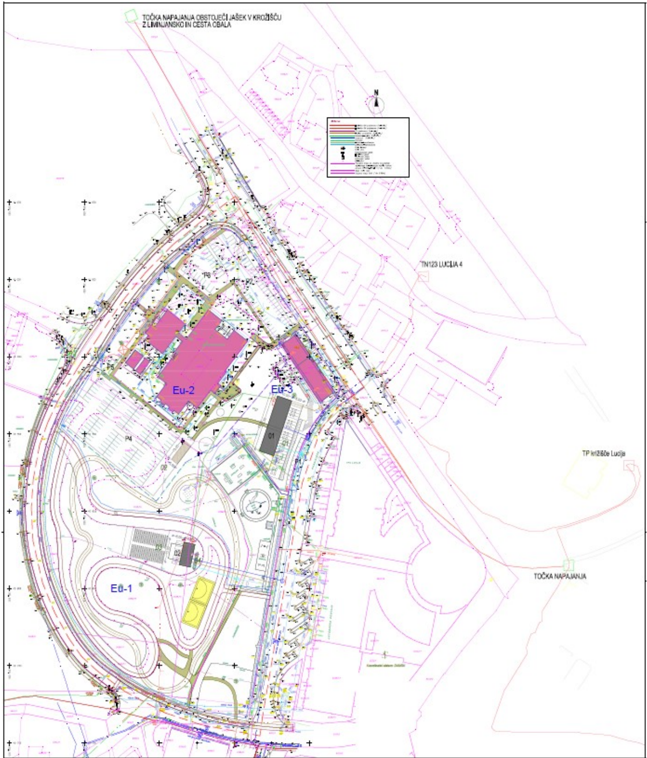
Slika 3: Prikaz poteka javne komunalne infrastrukture; OPPN »PARK SONCE«, julij 2016, št. lista 7