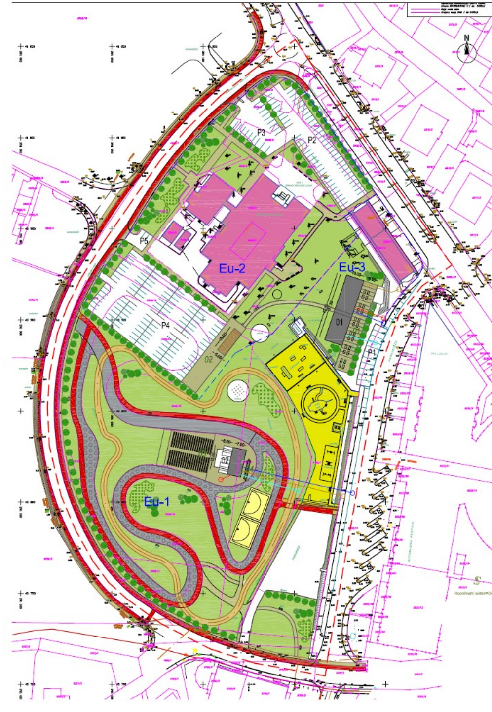
Slika 1: Zazidalna situacija; OPPN »PARK SONCE«, št. lista 4