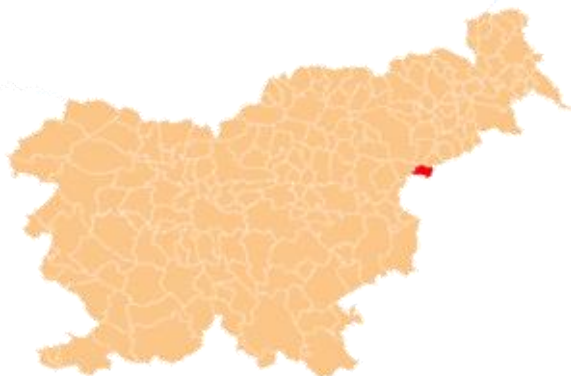
Slika: Lega občine Rogatec v Sloveniji