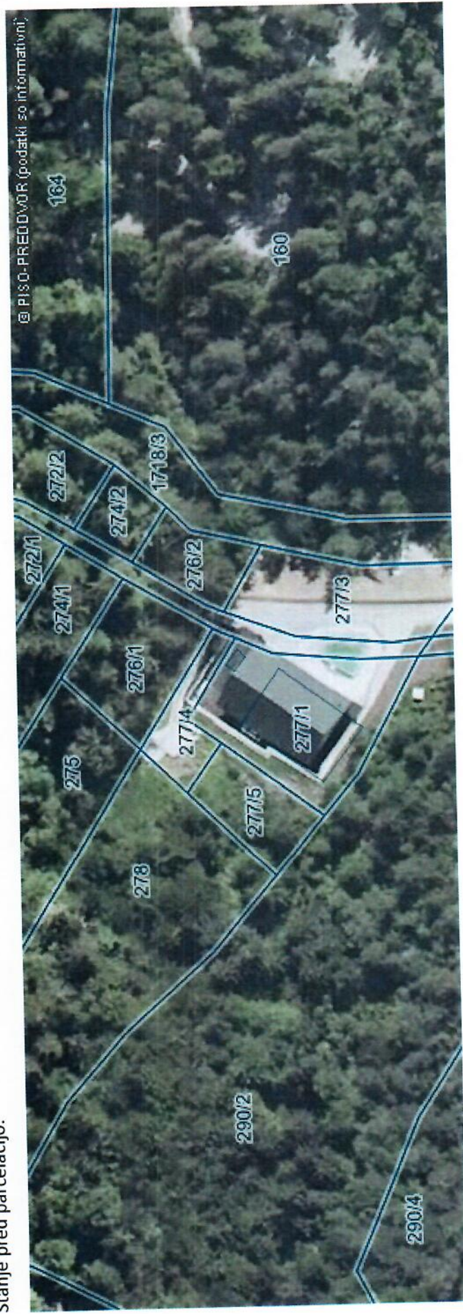
Stanje pred parcelacijo.