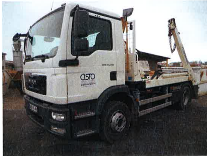
Fotografija 14: Vozilo za prevoz kontejnerjev

Za zbiranje in prevoz odpadkov iz zbirnih centrov, uporabljamo specialna komunalna vozila za odvoz kontejnerjev večjega volumna: