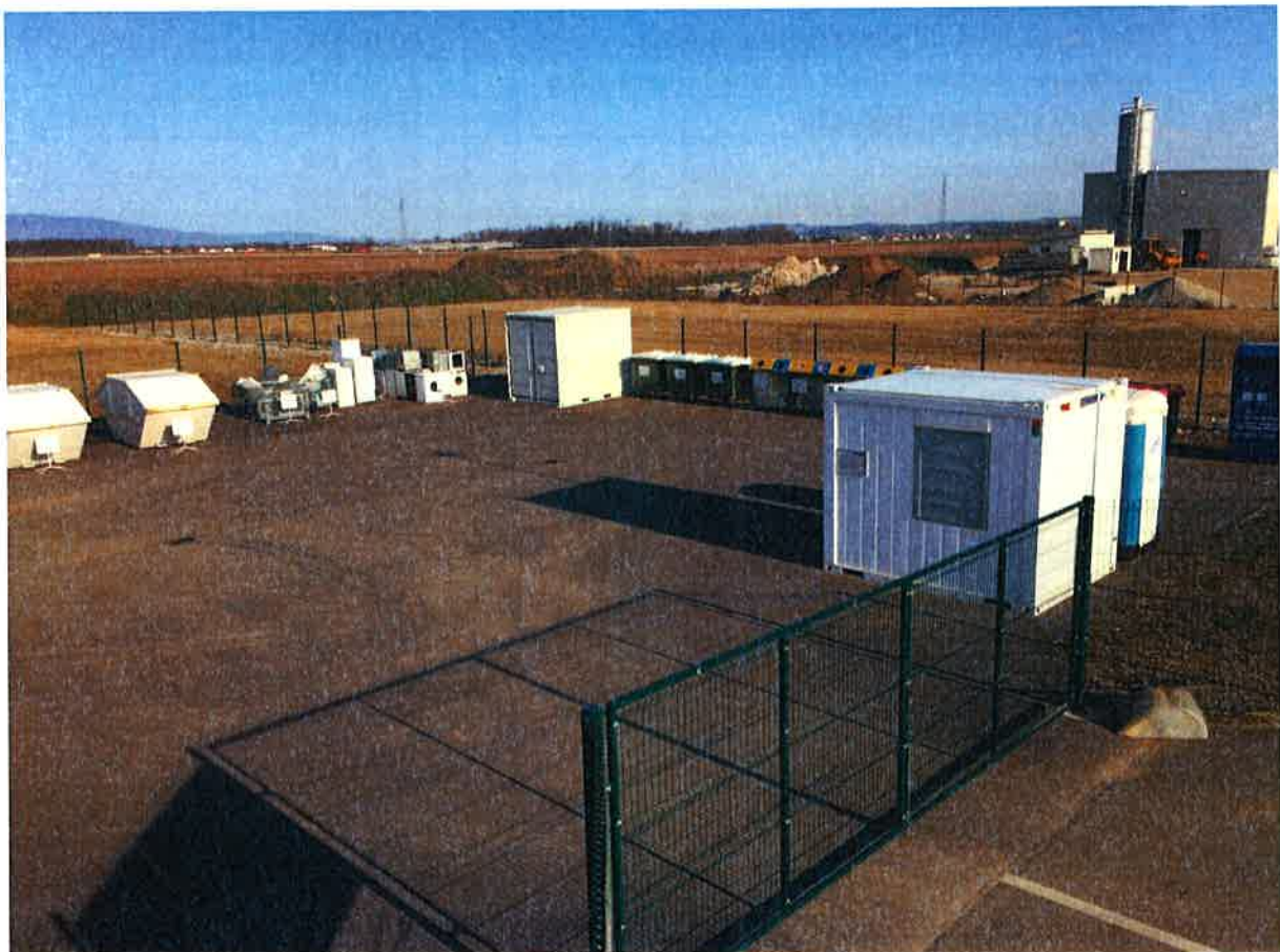
Fotografija 1: Zbirni center Videm

Datumi obratovanja zbirnega centra bodo navedeni na koledarju odvoza odpadkov ter na spletni strani https://cistomesto.si/zbirni-centri/ .