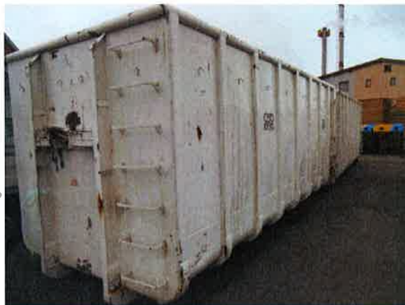
Fotografija 10 in 11: Kovinski kontejnerji