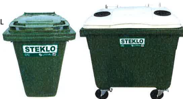
Fotografija 8 in 9: Posode za zbiranje stekla (steklene embalaže)