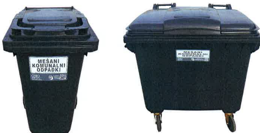
Fotografija 2 in 3: Posode za mešane komunalne odpadke