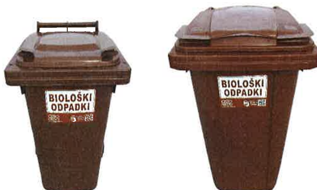
Fotografija 4: Posode za biološke odpadke