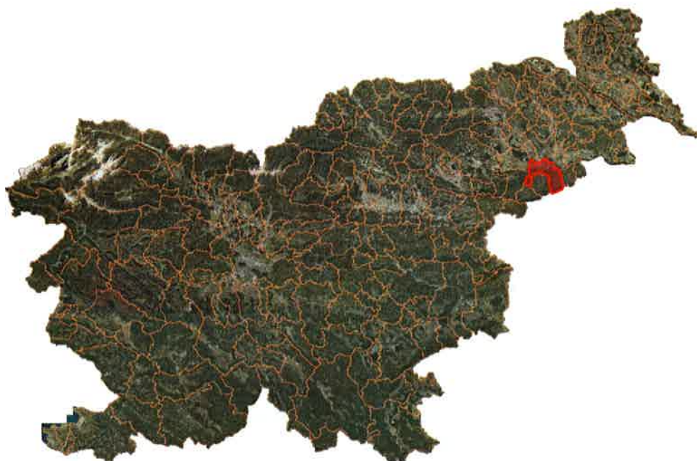
Slika 2: Lega občine Videm