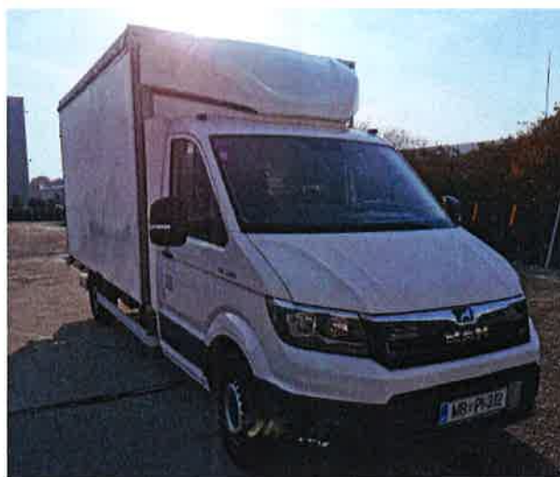
Fotografija 18: Vozila za prevoz in zbiranje nevarnih odpadkov

Za zbiranje in prevoz nevarnih frakcij uporabljamo specialna vozila, s pokritim kesonom in dovoljenjem za prevoz nevarnih snovi.