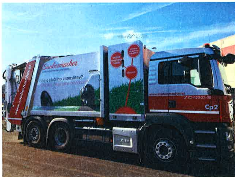
Fotografija 19: Vozilo za pranje zabojnikov za zbiranje bioloških odpadkov