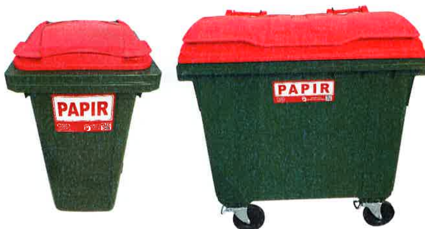
Fotografija 5 in 6: Posode za zbiranje papirja

Za zbiranje plastične embalaže ter ločenih frakcij iz plastike bomo uporabljali: