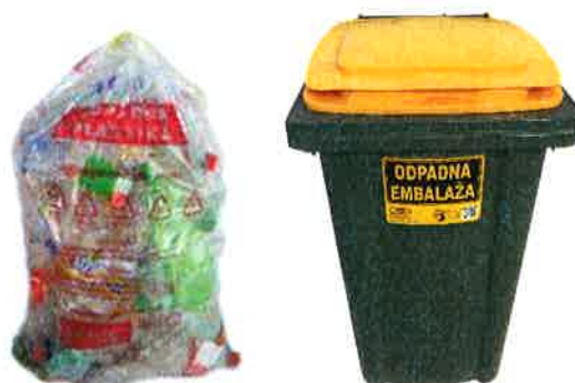
Fotografija 7: Vrečka za mešano embalažo

Za zbiranje steklene embalaže, uporabljamo plastične zabojnike, volumnov 240 l in 1100 l in sicer: