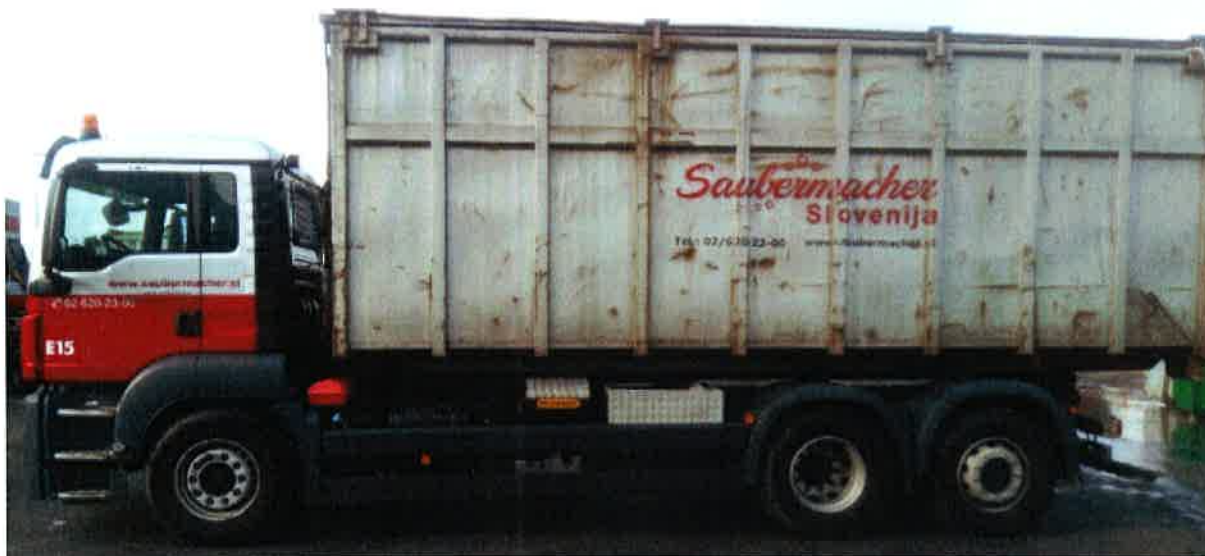
Fotografija 17: Vozilo za prevoz kotalnih prekucnikov

Za prevzemanje in prevoz kosovnih odpadkov uporabljamo kontejnerska vozila ter vozila za prevoz kotalnih prekucnikov.