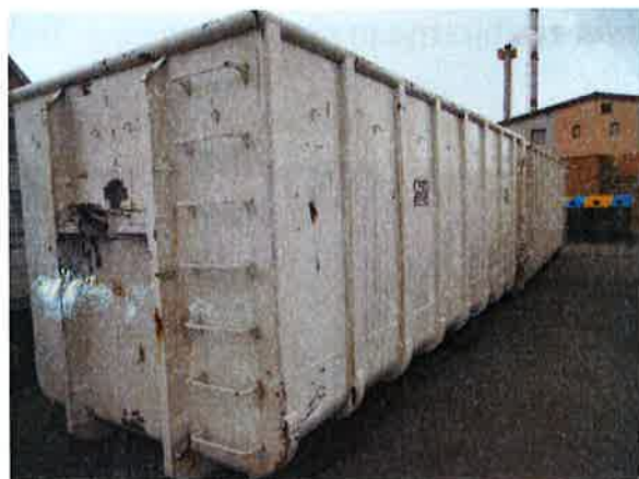
Fotografija 15 in 16: Kontejnerji različnih volumnov za zbiranje kosovnih in drugih odpadkov