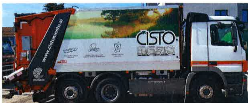
Fotografija 12 in 13: Smetarska vozila