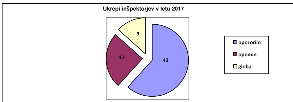
Grafikon 2: Izrečeni ukrepi inšpekcije, v prekrškovnih postopkih, v letu 2017