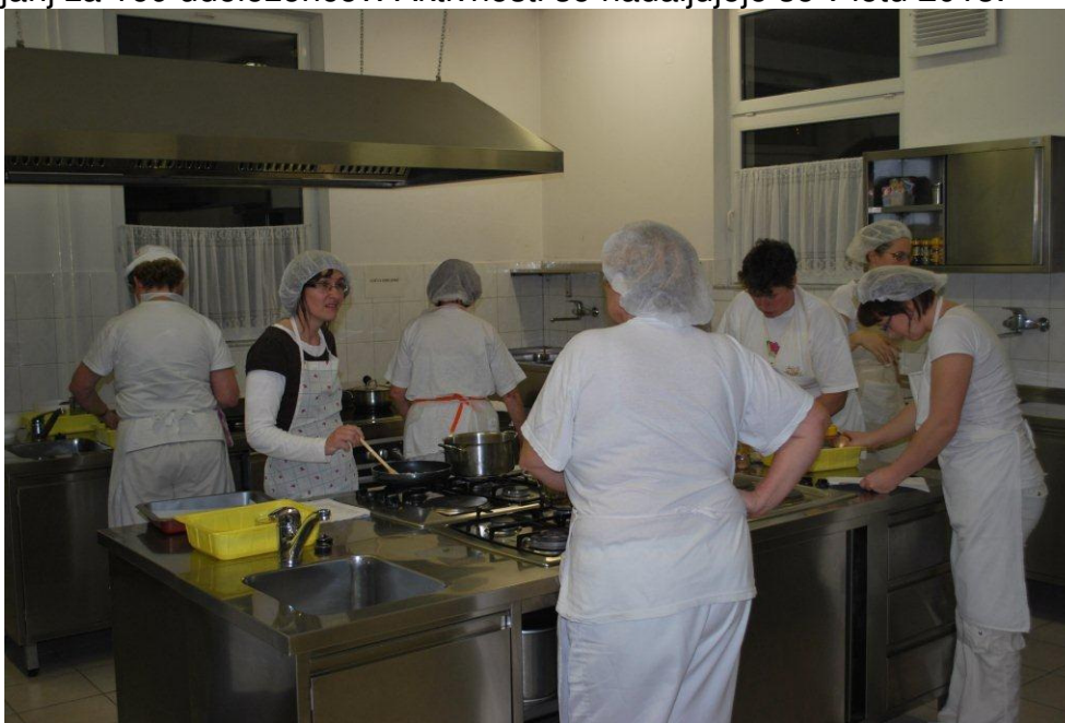
Tečaj V kuhinji od A do Ž (projekt Neformalno izobraževanje), izvedba v Zrečah

Start projekta je bil s 1. 1. 2012. Do sedaj smo izvedli enajst 50-urnih sklopov usposabljanj za 169 udeležencev. Aktivnosti se nadaljujejo še v letu 2013.