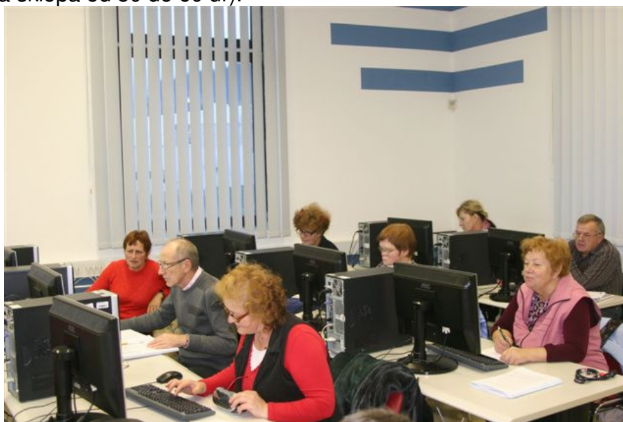
Tečaj Računalniška pismenost za odrasle, izvedba Zreče

Program se je pričel izvajati v letu 2010, zaključek programa bo v letu 2013. V letu 2012 smo v računalniška opismenjevanja vključili 166 udeležencev (trajanje posameznega vsebinskega sklopa od 50 do 60 ur).