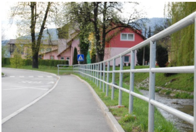
Rezultat projektne dela dijakov: varovalna ograja v bližini šole