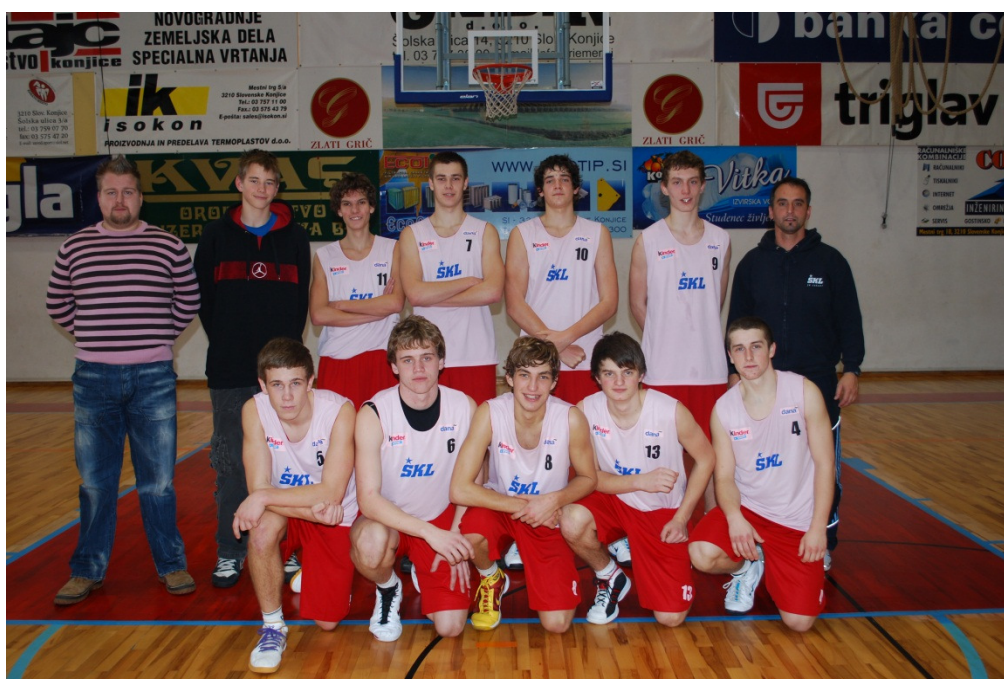
Košarkarska ekipa s trenerjem in z mentorjem

S ciljem medsebojnega spoznavanja dijakov prvih letnikov smo tretjo uro športne vzgoje izvedli strnjeno v Centru šolskih in obšolskih dejavnosti v Tolminu. Izvedeni so bili tudi vsi športni dnevi v skladu z Letnim delovnim načrtom. Sodelovali smo na košarkarskih tekmovanjih, in sicer v ligi ŠKL, tekmovali pa smo tudi na šolskem športnem tekmovanju v košarki na državni ravni, kjer smo zasedli odlično 4. mesto v državi.