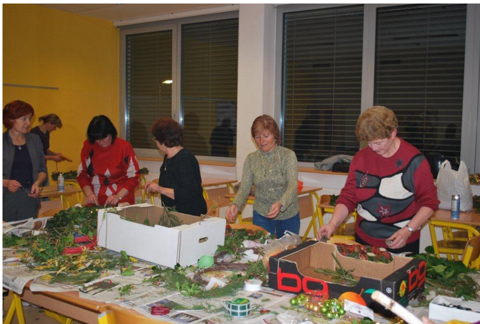
Tečaj Kvalitetno bivanje in vključitev v življenje v kraju bivanja in v RS (projekt Neformalno izobraževanje), izvedba v Slovenskih Konjicah