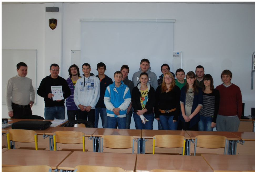
Kandidati skupaj s članoma izpitne komisije