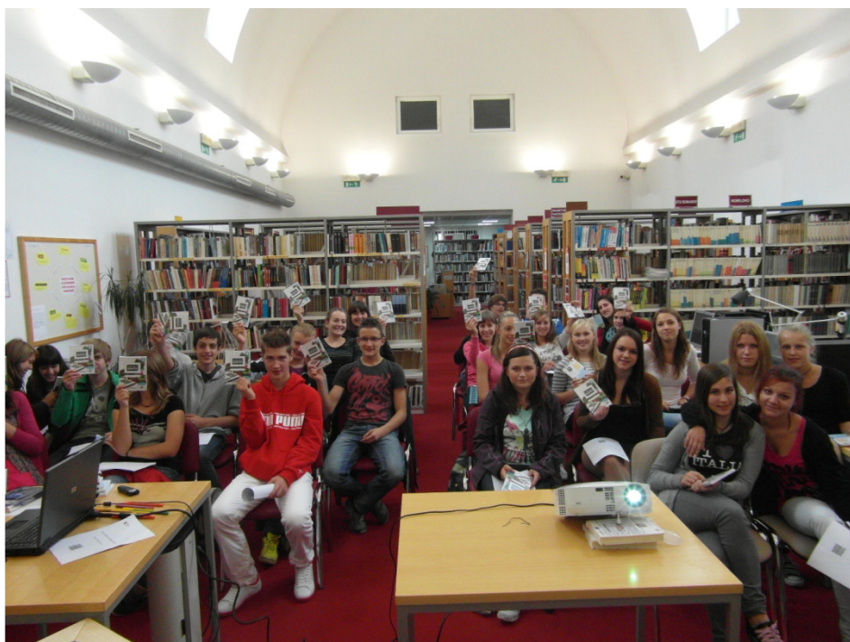
Projekt Rastem s knjigo

Dijaki so v sodelovanju s profesorji pripravili časopis GoSKo, ki je bil razdeljen tudi obiskovalcem na informativnih dnevih. Konec šolskega leta smo izdali tudi publikacijo Letopis.