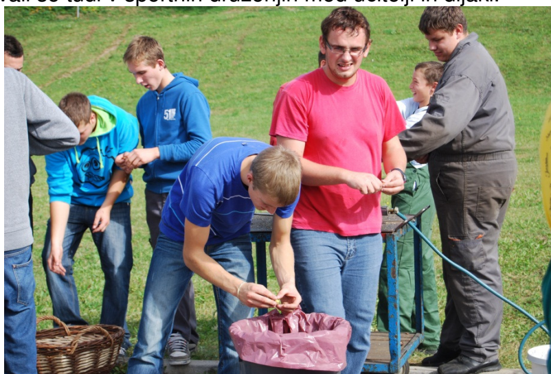
Kostanjev piknik v režiji dijaške skupnosti