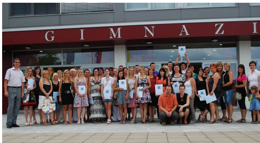
Podelitev spričeval zaključnih izpitov in poklicne mature 2012

K zaključnem izpitu (trgovec, gastronom-hotelir in oblikovalec kovin-orodjar) je pristopilo 11 kandidatov, ki so bili vsi uspešni.