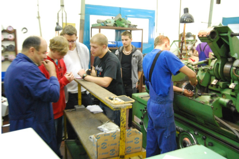
Dijaki iz Würzburga pri praktičnem pouku v šolski delavnici