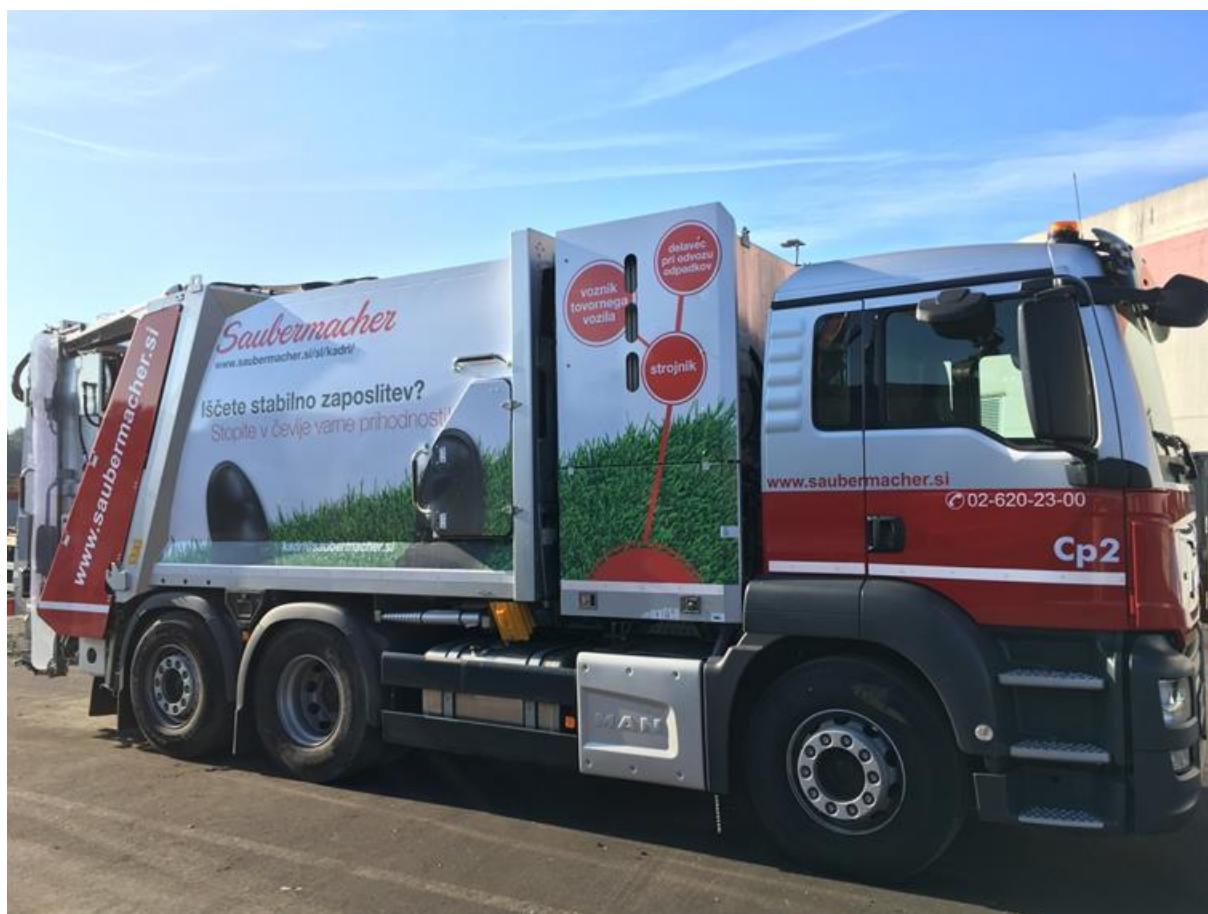
Fotografija 21: Vozilo za pranje zabojnikov za zbiranje bioloških odpadkov