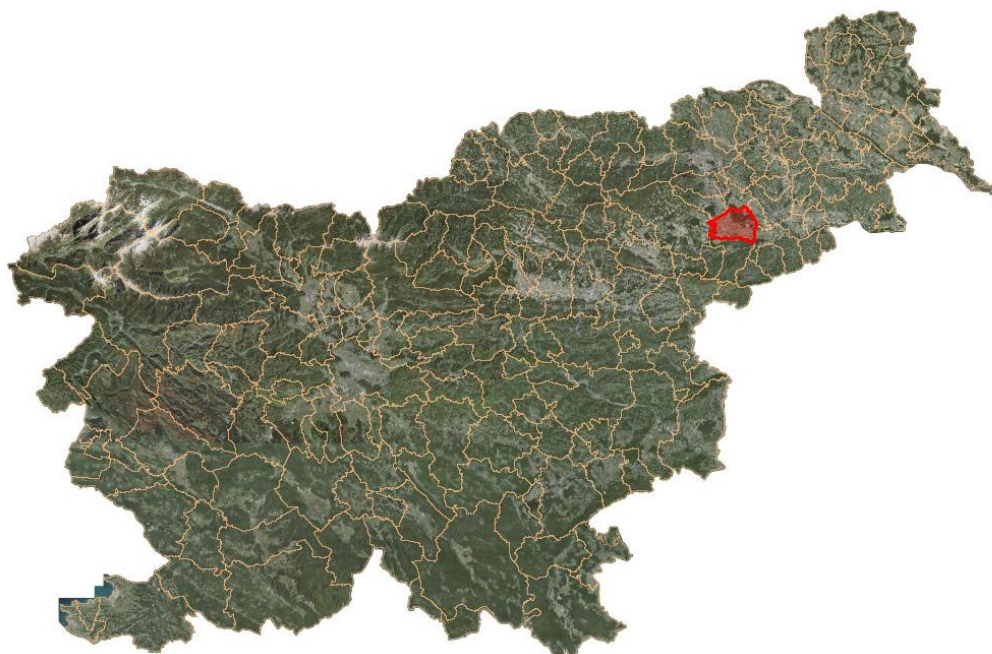
Slika 2: Lega občine Kidričevo