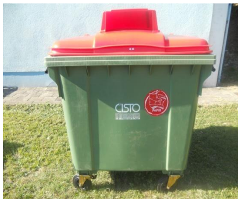
Fotografija 5 in 6: Posode za zbiranje papirja

Za zbiranje plastične embalaže ter ločenih frakcij iz plastike bomo uporabljali: