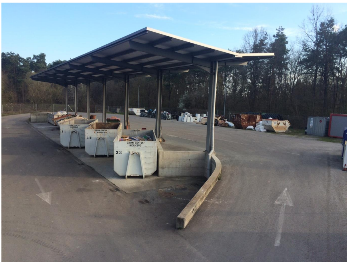
Fotografija 1: Zbirni center Kidričevo

Datumi obratovanja zbirnega centra so navedeni na koledarju odvoza odpadkov.