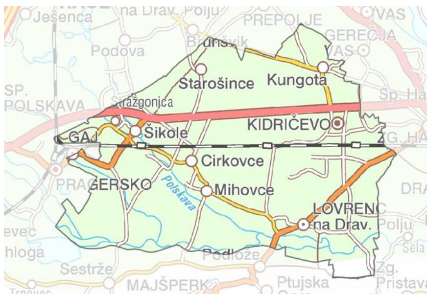
Slika 1: Zemljevid občine Kidričevo