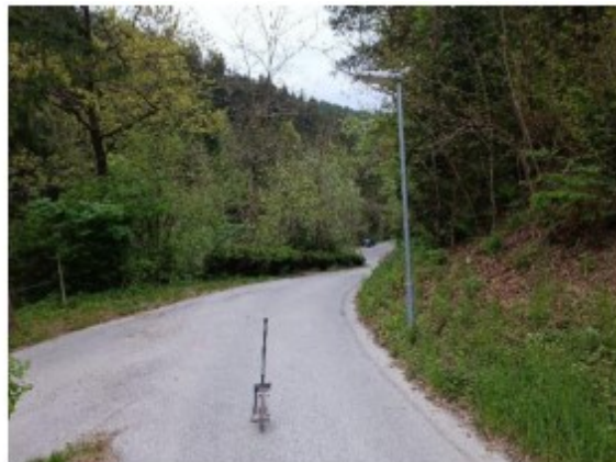
Slika 5: Začetek in konec meje obdelave sanacije JP 851803