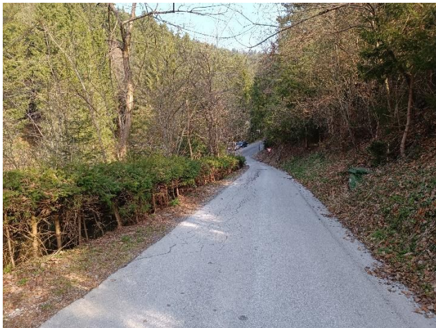
Slika 4: Posedena desna polovica asfaltirane ceste JP 851803

Sanacija odseka javne poti JP 851803 (cca. 64,00 m) od priključka na LC 350371 do hišnega cestnega priključka Prisoje 68, poteka po obstoječi asfaltirani cesti, s povprečnimi širinami 2,70 – 3,00 m in z dokaj strmimi vkopnimi in nasipnimi brežinami. Desna polovica ceste se je posedla, v dolžini cca. 30 m.