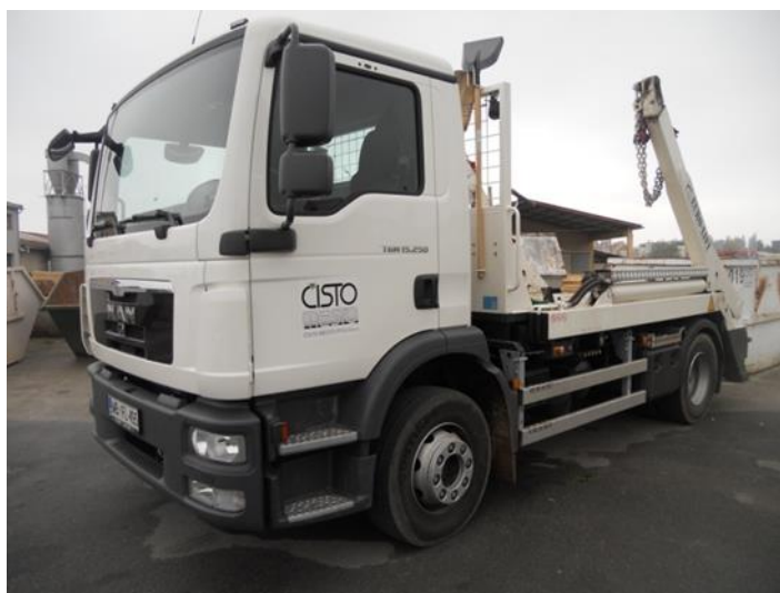
Fotografija 14: Vozilo za prevoz kontejnerjev

Za zbiranje in prevoz odpadkov iz zbirnih centrov, uporabljamo specialna komunalna vozila za odvoz kontejnerjev večjega volumna: