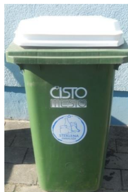
Fotografija 8 in 9: Posode za zbiranje stekla (steklene embalaže)