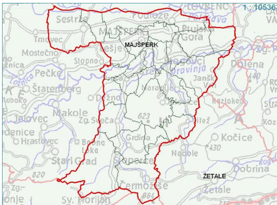
Slika 1: Zemljevid občine Majšperk