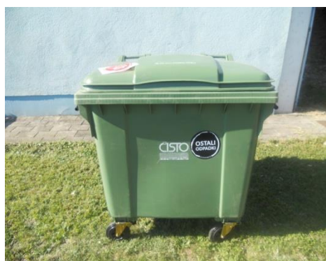
Fotografija 2 in 3: Posode za mešane komunalne odpadke