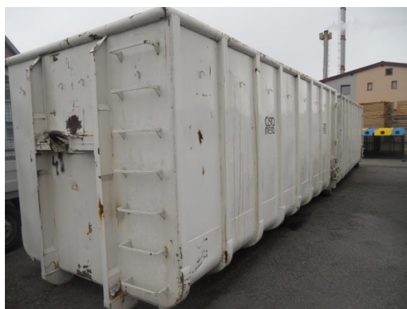
Fotografija 15 in 16: Kontejnerji različnih volumnov za zbiranje kosovnih in drugih odpadkov