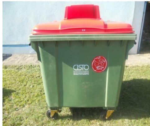
Fotografija 5 in 6: Posode za zbiranje papirja

Za zbiranje plastične embalaže ter ločenih frakcij iz plastike bomo uporabljali: