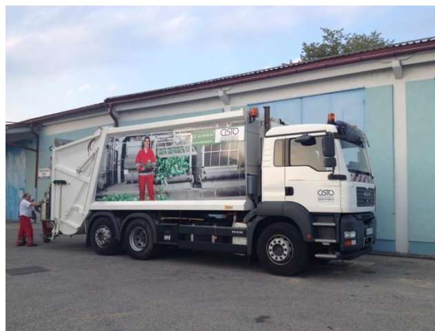
Fotografija 12 in 13: Smetarska vozila