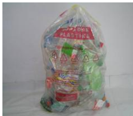
Fotografija 7: Vrečka za mešano embalažo

Za zbiranje steklene embalaže, ki poteka preko zbiralnic ločenih frakcij uporabljamo plastične zabojnike, volumnov 240 l in 1100 l in sicer: