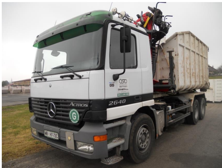
Fotografija 17: Vozilo za prevoz kotalnih prekucnikov

Za prevzemanje in prevoz kosovnih odpadkov uporabljamo kontejnerska vozila ter vozila za prevoz kotalnih prekucnikov.