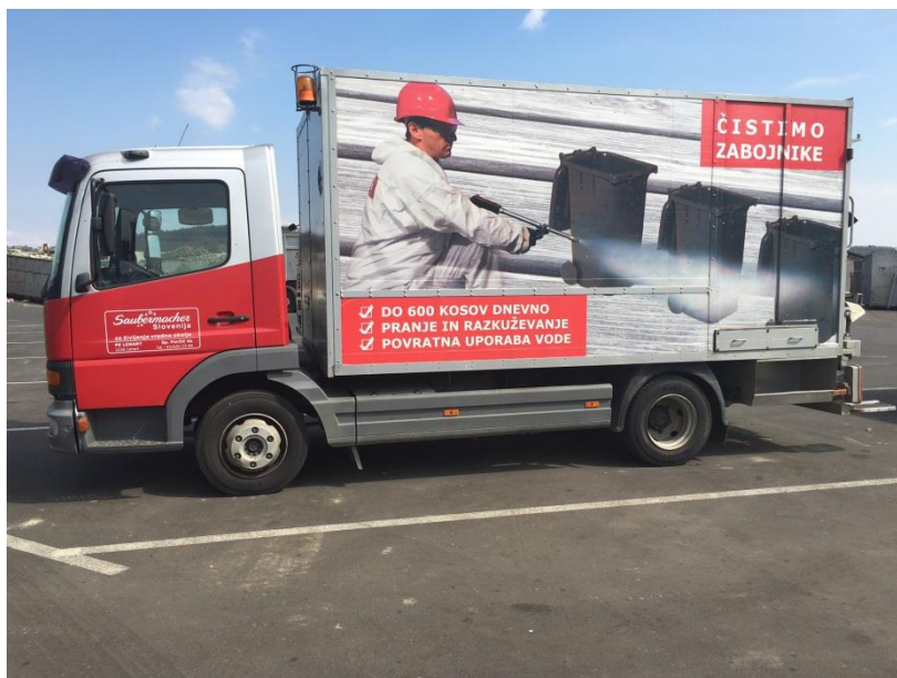
Fotografija 21: Vozilo za pranje zabojsnikov za zbiranje bioloških odpadkov