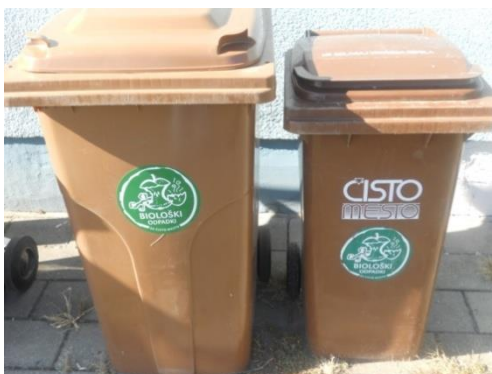
Fotografija 4: Posode za biološke odpadke