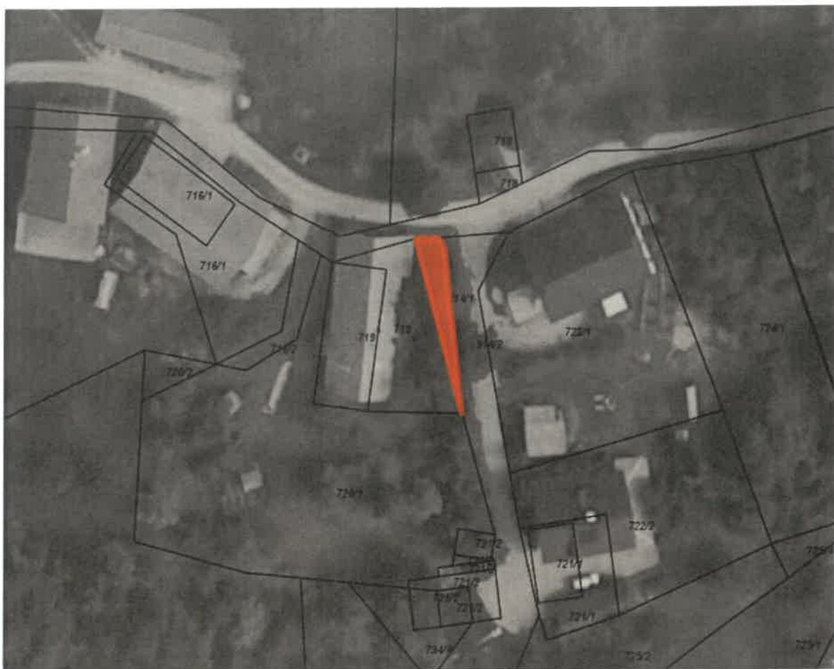
parc. št. 914/1 k.o. Zgornja Besnica