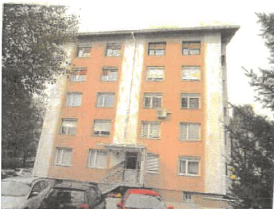
Dvosobno stanovanje na naslovu zoisova ulica 7, Kranj