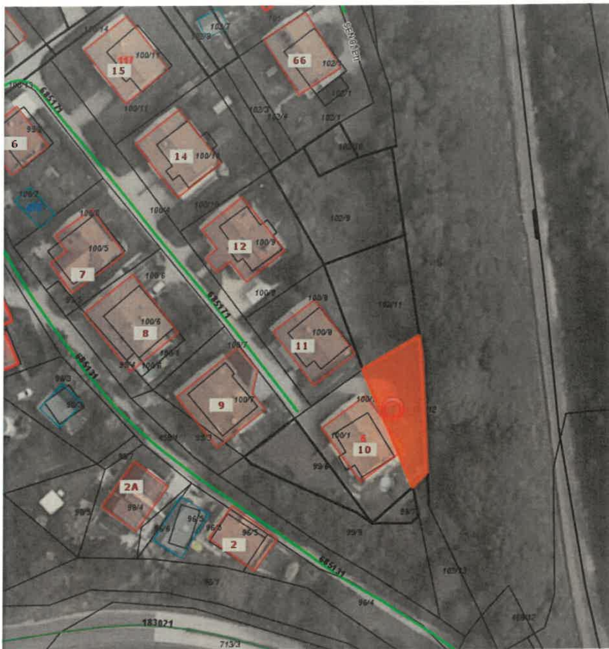
parc. št. 102/12 k.o. Spodnja Besnica