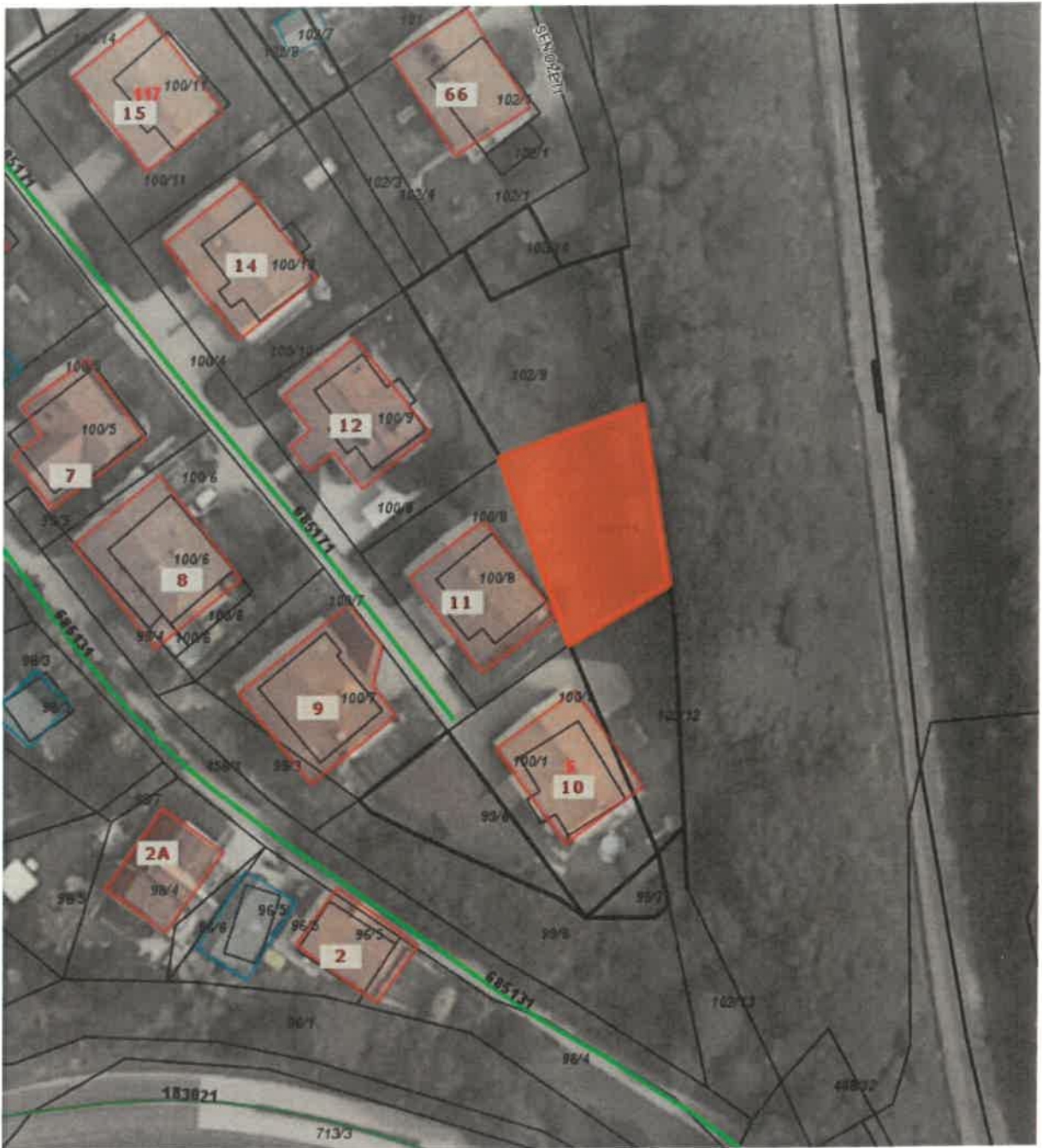
parc. št. 102/11 k.o. Spodnja Besnica