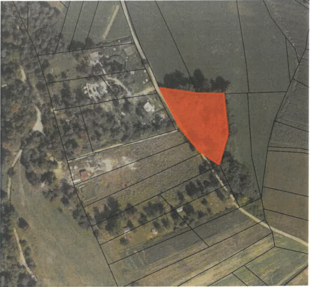
parc. št. 853 k.o. Gameljne