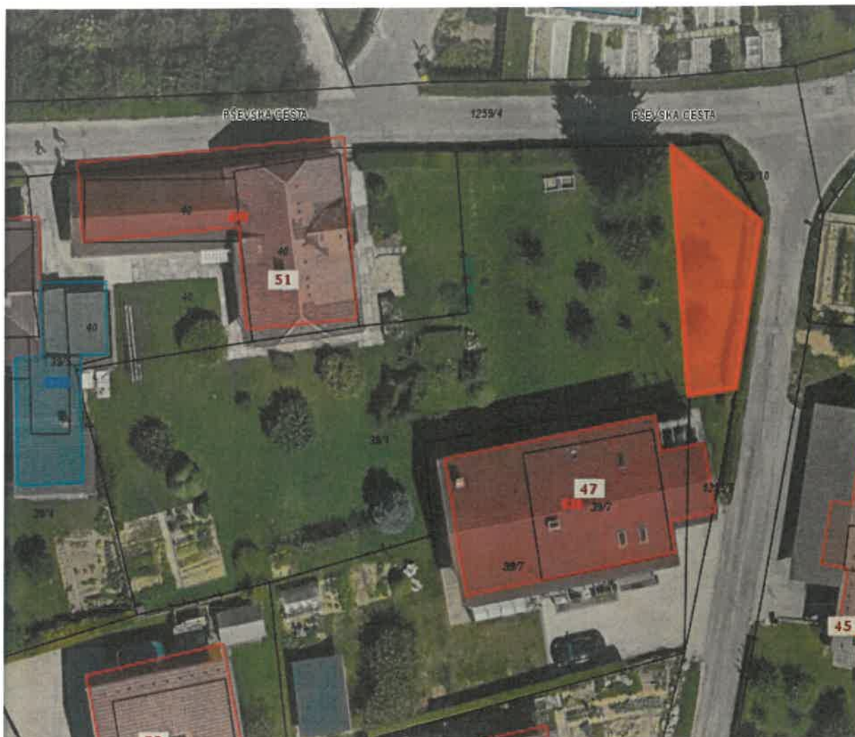
Parc. št. 1259/9 k.o. Stražišče