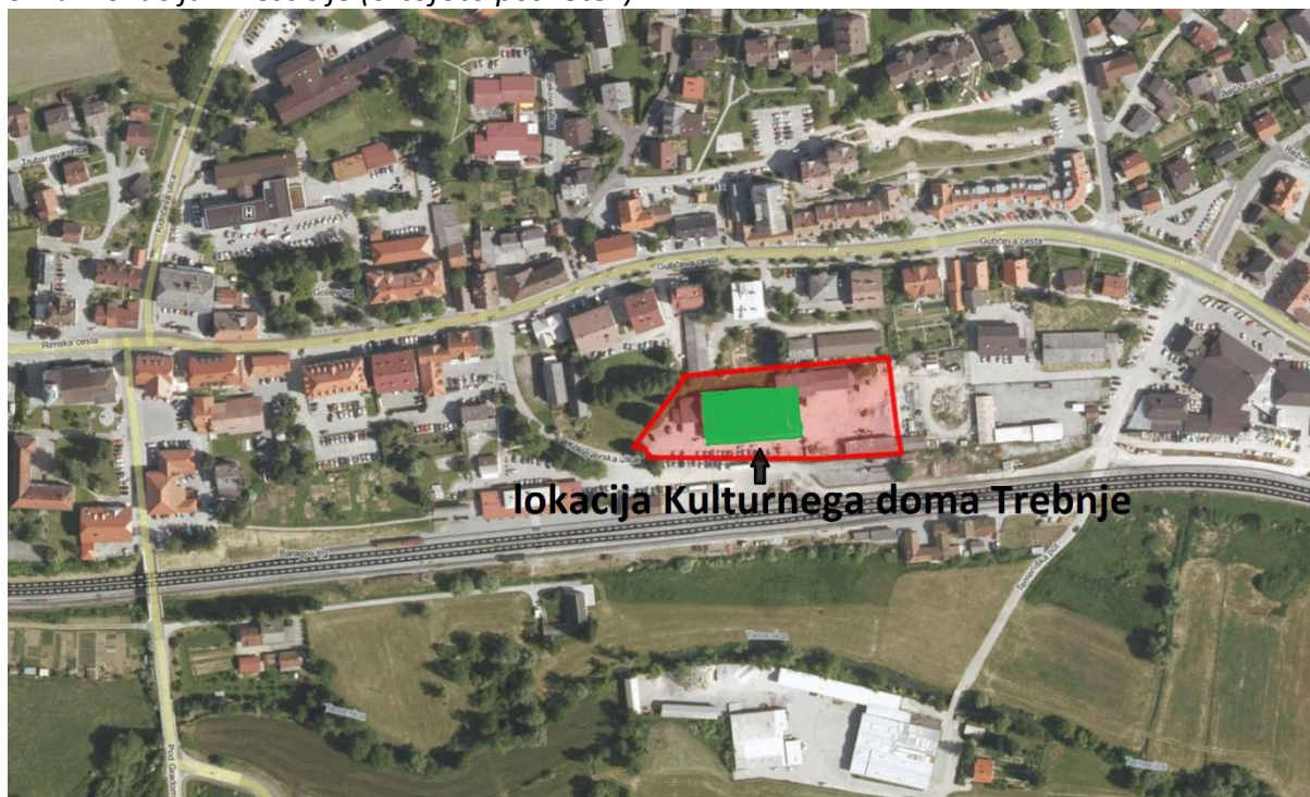
Slika: Lokacija investicije (ortofoto posnetek)