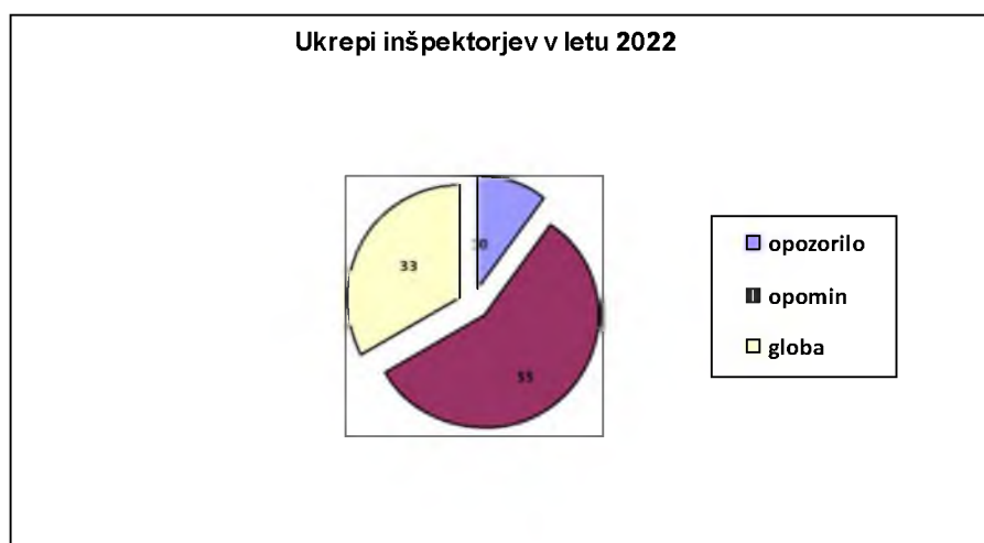
Grafikon 3: Izrečeni ukrepi inšpekcije v letu 2022