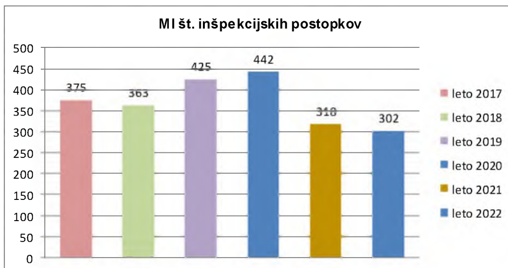
Grafikon 2: MI število inšpekcijskih postopkov v letih 2017-2022