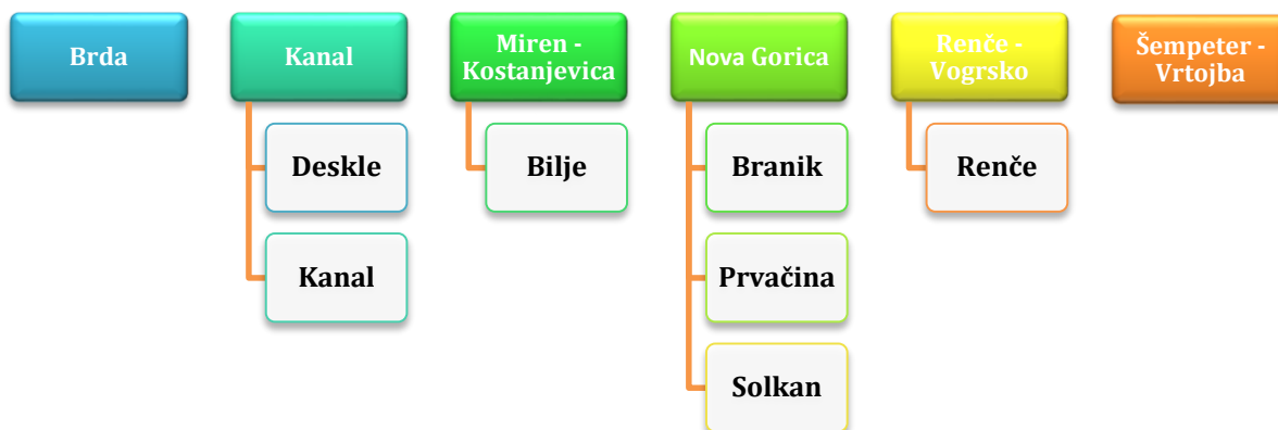
Slika 1 Krajevne knjižnice v posameznih občinah