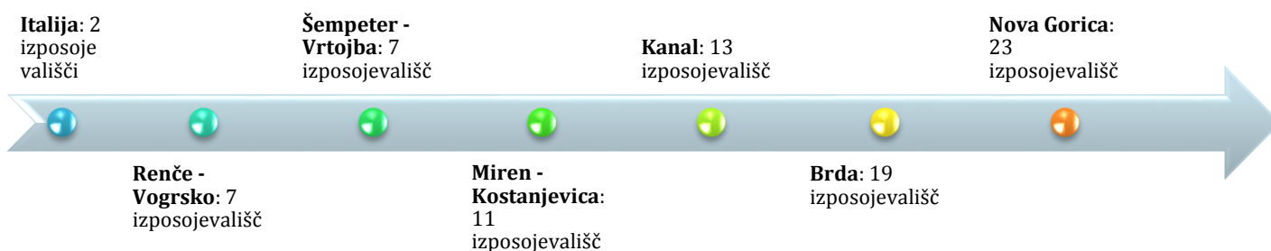
Slika 2 Število postajališč potujoče knjižnice po občinah v letu 2015