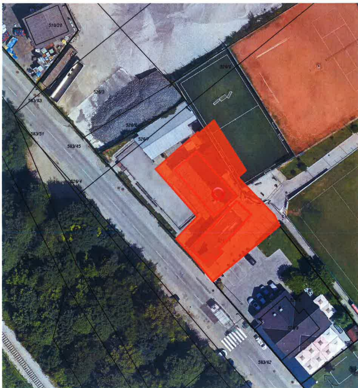
Parc. št. 526/11 k.o. Drulovka