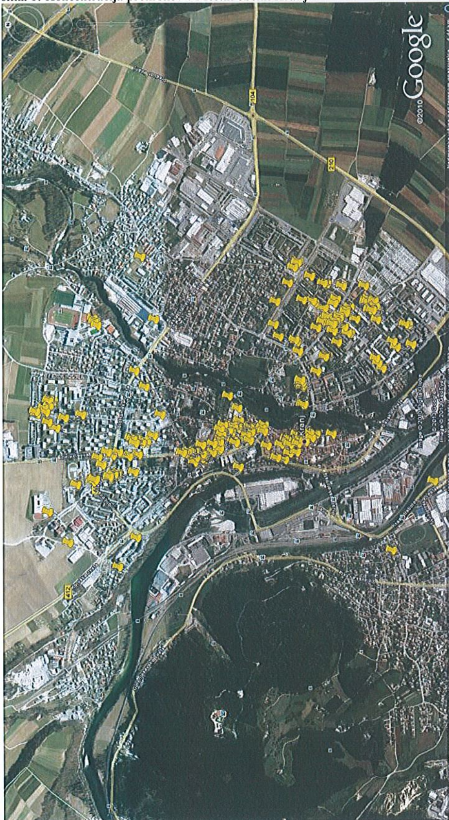
Slika prikazuje koncentracijo prekrškov, brez prekrškov iz področja prekoračitve hitrosti.