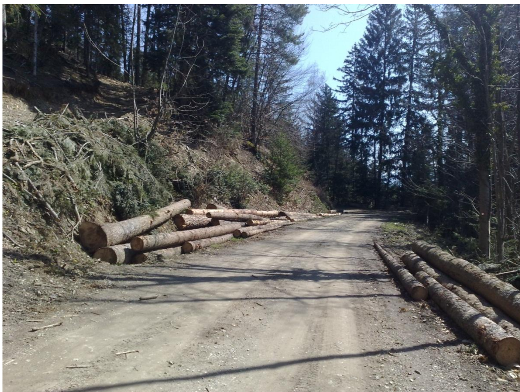
Poškodovana občinska cesta zaradi spravila lesa