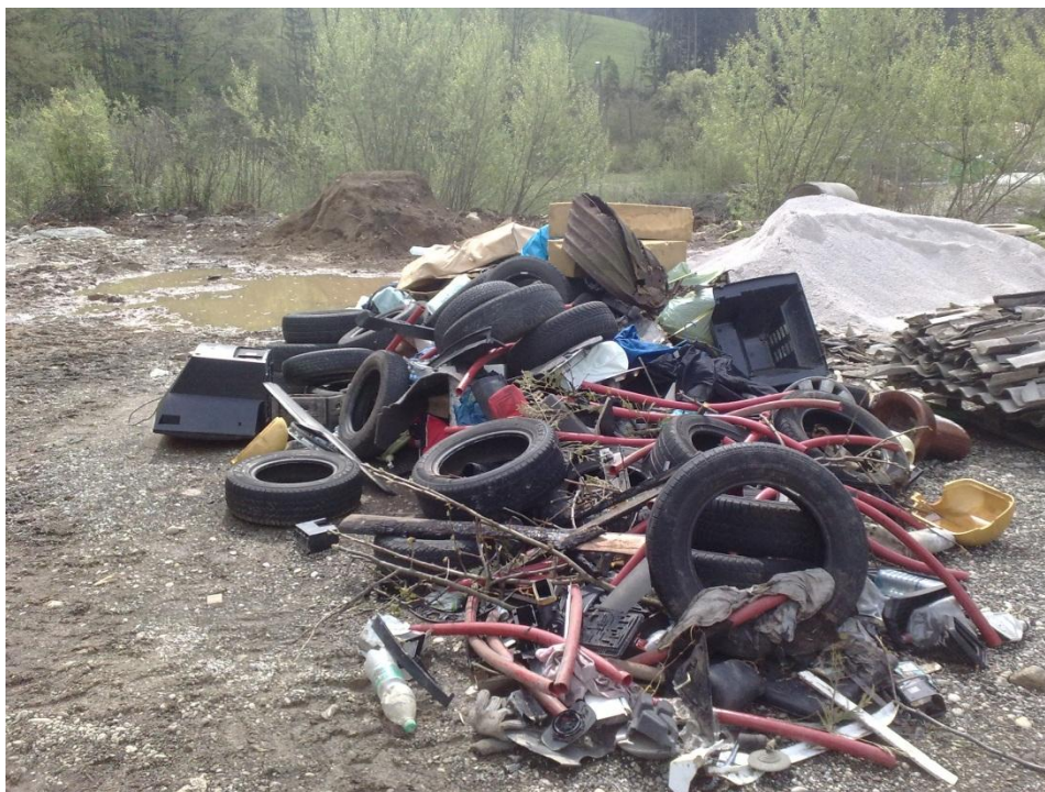
Odlagališče ob Radoljni