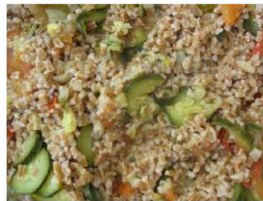
Slika 3: Kašota s pirino kašo