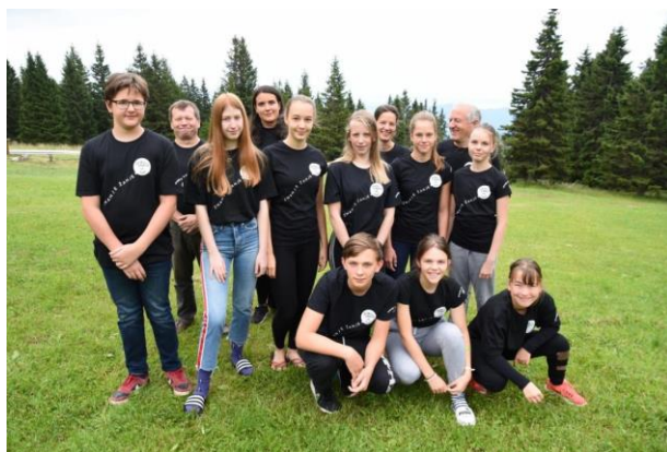
Slika 2: Udeleženci lanskega tabora Rogla

Pripravila: Katjuša Črešnar, višja svetovalka za okolje in prostor