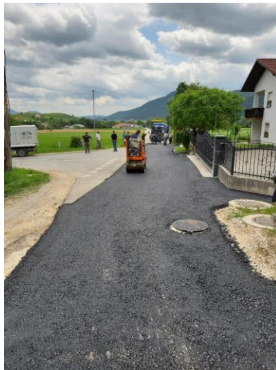
Slika 14: Izvedba odvodnjavanja Pirš

Dela so bila zaključena v mesecu juniju 2020 zaradi epidemije in prilagojene dinamike del. Končna vrednost z več manj deli ter dodatnimi deli bo znana po končnem obračunu izvedenih del.