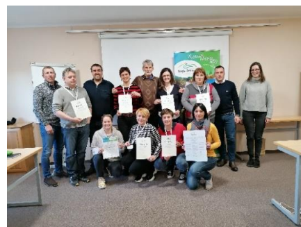
Sliki 5 in 6: Delavnice

V sodelovanju s Šolskim centrom Slovenske Konjice – Zreče so nastali trije predlogi jedilnikov , kot zasnova kulinaričnega produkta »Okus prazgodovinskih Zreč«.