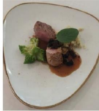
Slika 2: Srnin medaljon z gobicami in kašoto