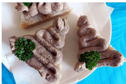
Slika 1: Domača pašteta na nekvašenem kruhku