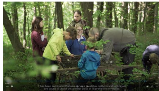
Sliki 3 in 4: Izseka iz filmov

Konec lanskega in v začetku letošnjega leta smo izvedli paket delavnic na temo zelenega turizma.