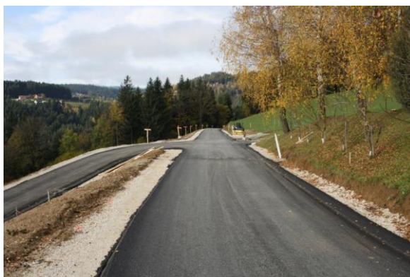
Slika 15: Cesta Božje

Pripravil: Andrej Furman, delovodja za komunalno infrastrukturo