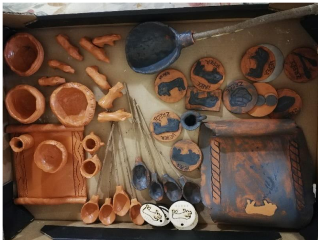
Sliki 11 in 12: Spominki

in zasnova številnih »prazgodovinskih spominkov« , med njimi zajemalka, keramična posoda, amfora, veper, meni karta, magnetki, obeski, lesene table, pladnji in inovativni spominek v obliki 2 artvive filmov (en na osnovi vepra in drugi na osnovi amfore iz Brinjeve gore).