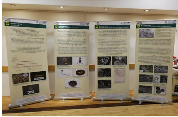
Slika 13: Predstavitveni plakati

Nadaljevati želimo z raziskovanjem Brinjeve gore oz. ga nadgraditi z novimi metodami, zato so že bile izvedene geofizikalne raziskave. Na podlagi izsledkov le teh pripravljamo tudi arheološki tabor , ki bo potekal na Brinjevi gori od 26. 6. 2020 do 1. 7. 2020. 27. 6. 2020 bodo prav tako na Brinjevi gori zvedene še arheološke delavnice na temo: