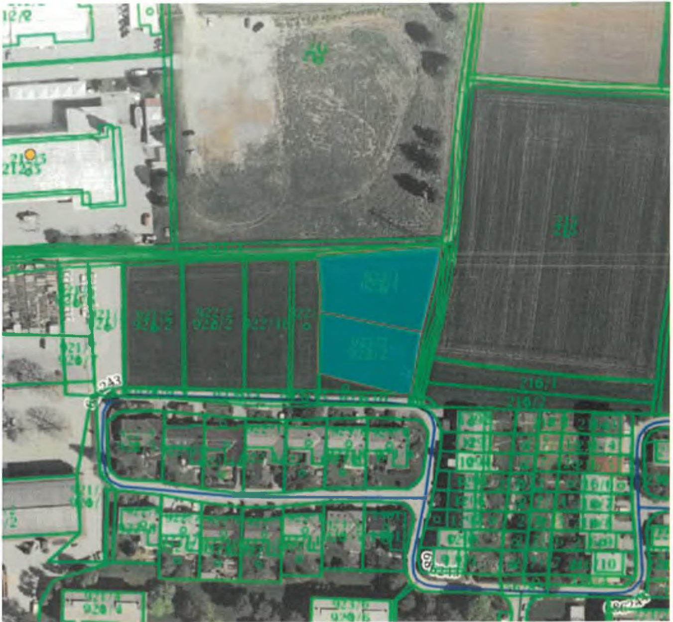
parc. št. 923/1 in 923/2 k.o. Kranj