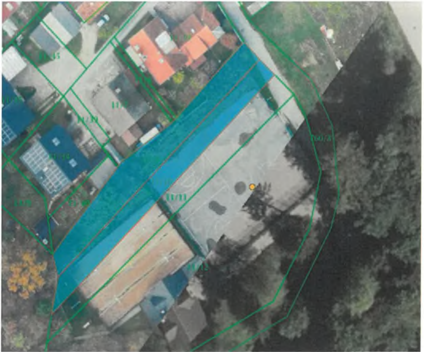
Parc. št. 11/9 in 11/10 k.o. Hrastje