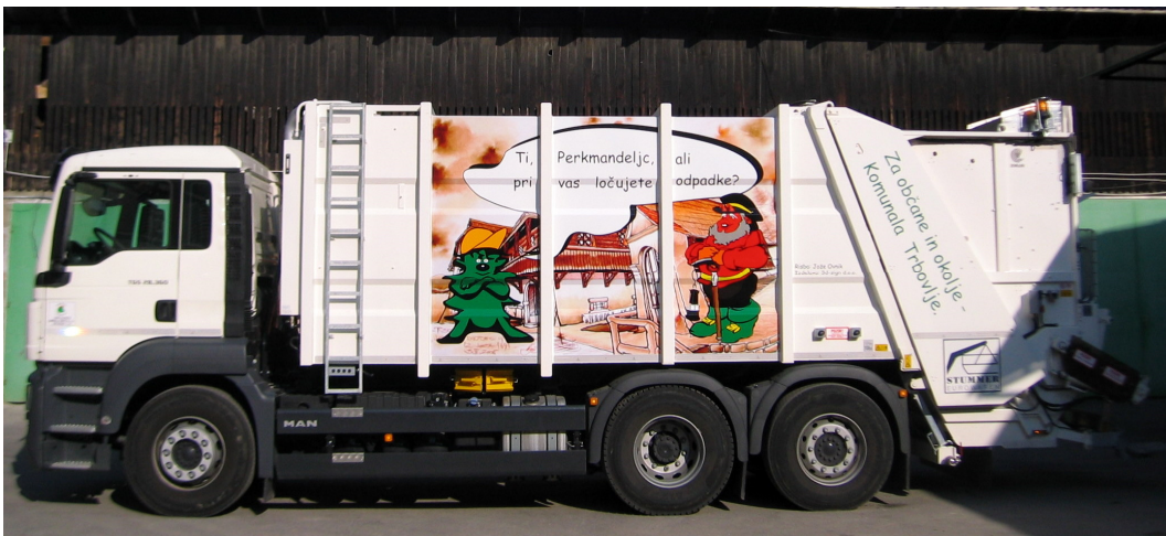
Slika št. 5: kombinirano smetarsko-pralno vozilo za čiščenje zbiralnikov za odpadke

Zaradi povečanega obsega zbiranja oz. odvozov odpadkov smo v letu 2011 nabavili novo specialno vozilo za odvoz odpadkov, ki je hkrati tudi pralno vozilo, s katerim lahko čistimo zbiralnike za biološke odpadke. V letu 2012 pa smo nabavili še eno manjše specialno vozilo za odvoz odpadkov.