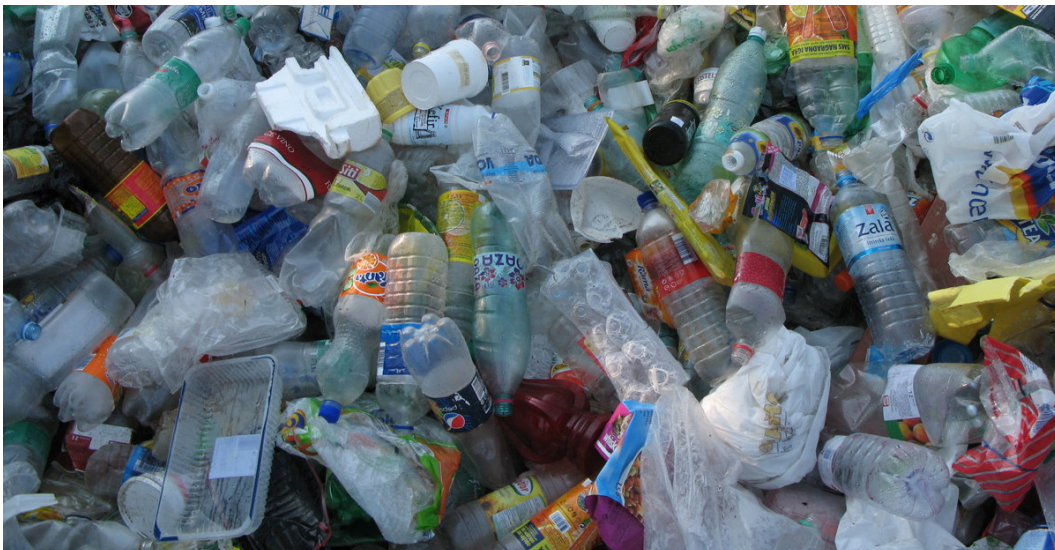
Slika št. 7: zbrana mešana embalaža

V letu 2012 smo odložili 58% vseh zbranih komunalnih odpadkov, 42% pa oddali v recikliranje oz. kompostiranje. Kar pomeni, da smo pri odlaganju odpadkov dosegli za 14% boljši rezultat kot v letu 2011. Od teh 42% ločeno zbranih odpadkov je bilo 15% bioloških odpadkov, ki so se kompostirali, 12% mešane embalaže, 4% papirja in kartona ter 3% stekla, namenjenega reciklaži. 8% je bilo zbranih ostalih ločenih odpadkov, od katerih se je večina namenila reciklaži (odpadna električna in elektronska oprema, pločevina, odpadne nagrobne sveče idr.), nevarni odpadki iz gospodinjstev pa strokovnemu uničenju.