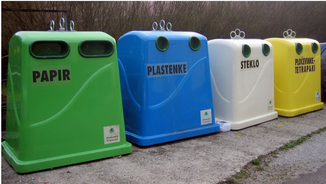
Slika št. 8: ekološki otok

Prostorska razporeditev zagotavljanja zbiranja komunalnih odpadkov: