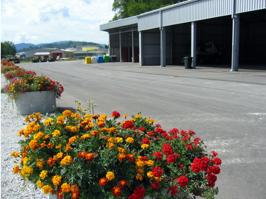
Slika št. 4: Zbirni center Neža

Zaradi povečanega obsega zbiranja oz. odvozov odpadkov smo v letu 2011 nabavili novo specialno vozilo za odvoz odpadkov, ki je hkrati tudi pralno vozilo, s katerim lahko čistimo zbiralnike za biološke odpadke. V letu 2012 pa smo nabavili še eno manjše specialno vozilo za odvoz odpadkov.