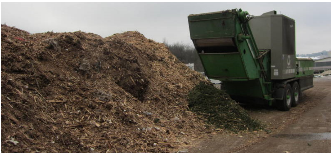
Slika št. 2: lesni sekanci v zbirnem centru Neža

V skladu z Uredbo o ravnanju z BIO odpadki mora izvajalec javne službe prednostno spodbujati povzročitelje odpadkov iz gospodinjstva k hišnemu kompostiranju, povzročiteljem odpadkov iz gospodinjstev, ki kuhinjske odpadke in zeleni vrtni odpad hišno kompostirajo, pa storitev zbiranja teh odpadkov ne zaračuna.