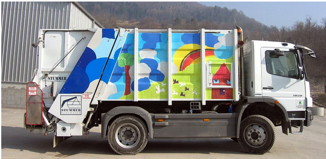
Slika št. 1: specialno vozilo za odvoz odpadkov

Uredba o ravnanju z biološko razgradljivimi kuhinjskimi odpadki in zelenim vrtnim odpadom določa obvezna ravnanja z biološko razgradljivimi kuhinjskimi odpadki, ki nastajajo v kuhinjah in pri razdeljevanju hrane zaradi izvajanja živilske dejavnosti, ter s kuhinjskimi odpadki, ki nastajajo v gospodinjstvu in zelenim vrtnim odpadom. Določa tudi vrste nalog, ki se izvajajo v okviru obvezne občinske gospodarske javne službe zbiranja komunalnih odpadkov na področju ravnanja s komunalnimi odpadki in zelenim vrtnim odpadom.