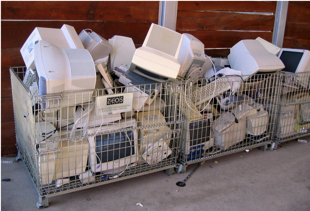
Slika št. 6: zbrana odpadna električna in elektronska oprema

V letu 2012 smo odložili 58% vseh zbranih komunalnih odpadkov, 42% pa oddali v recikliranje oz. kompostiranje. Kar pomeni, da smo pri odlaganju odpadkov dosegli za 14% boljši rezultat kot v letu 2011. Od teh 42% ločeno zbranih odpadkov je bilo 15% bioloških odpadkov, ki so se kompostirali, 12% mešane embalaže, 4% papirja in kartona ter 3% stekla, namenjenega reciklaži. 8% je bilo zbranih ostalih ločenih odpadkov, od katerih se je večina namenila reciklaži (odpadna električna in elektronska oprema, pločevina, odpadne nagrobne sveče idr.), nevarni odpadki iz gospodinjstev pa strokovnemu uničenju.