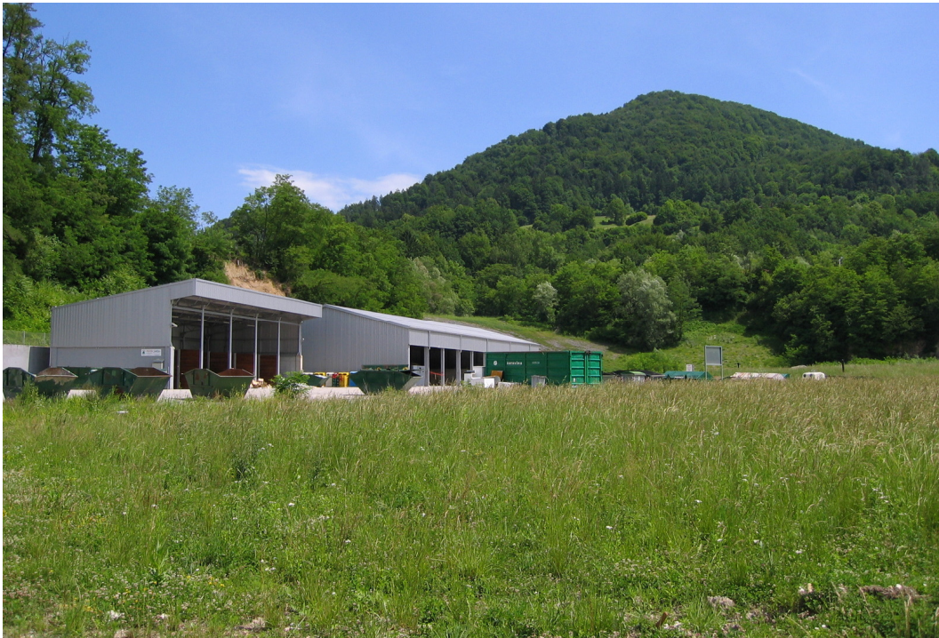
Slika št. 3: Zbirni center Neža

V organiziran odvoz odpadkov so praktično vključena vsa gospodinjstva v občini Trbovlje, kjer Komunala Trbovlje d.o.o. zbira in odpadke odvaža na regijsko deponijo Unično, ki je pričela obratovati 01. 06. 2004 in je v upravljanju podjetja CERUZ, d.o.o.